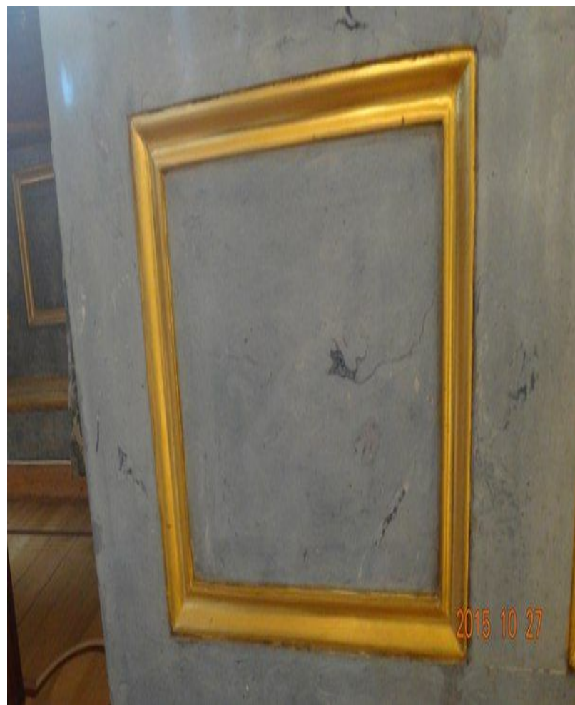
Золотая гостиная (комната 304)