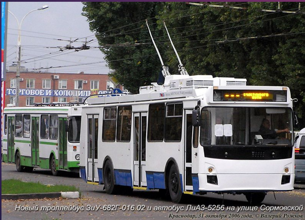
Новый троллейбус 31U-682Г-016.02 и автобус ЛиАЗ-5256 на улице Сормовской Краснодар, 31 октября 2006 года.