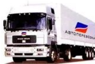
ТЯГАЧ С ПРИЦЕПОМ