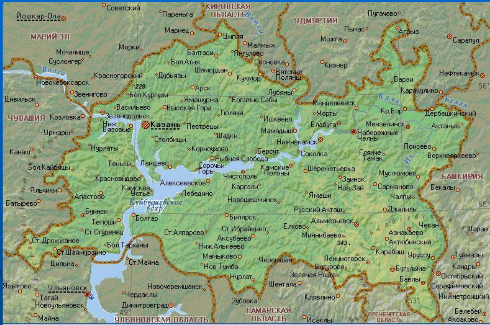
ТАТАРИЯ (РЕСПУБЛИКА ТАТАРСТАН)