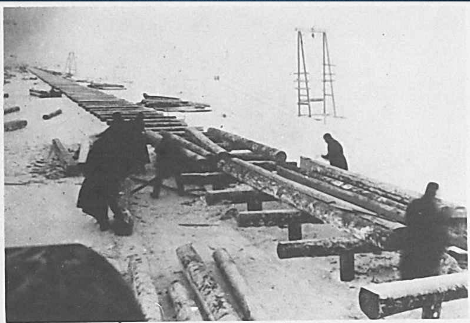
УКЛАДКА ПРОГОНОВ НА УЧАСТКЕ 40-го Ж. Д. БАТАЛЬОНА.