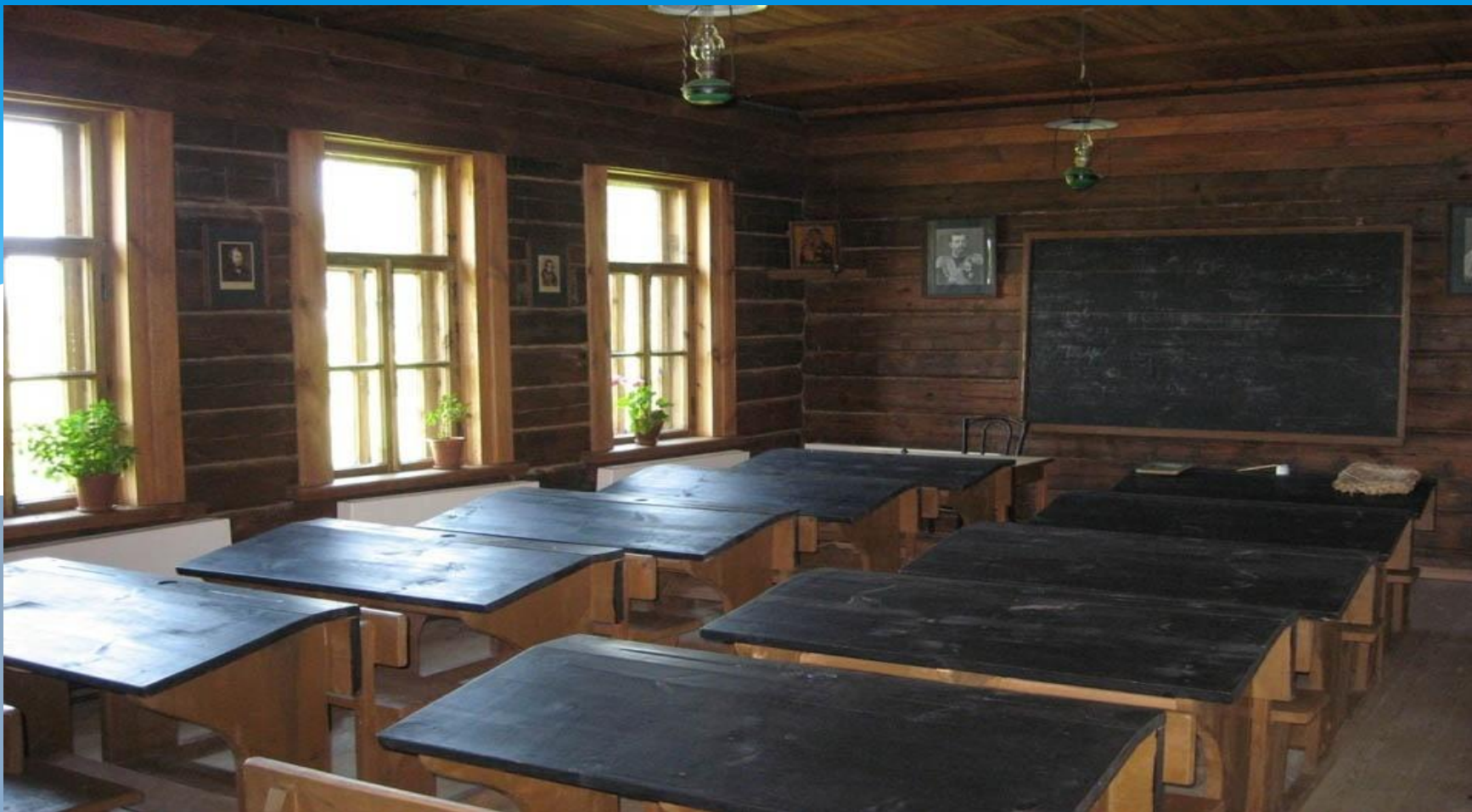
Класс в земской школе