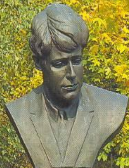
Памятник С.А. Есенину в селе Константиново