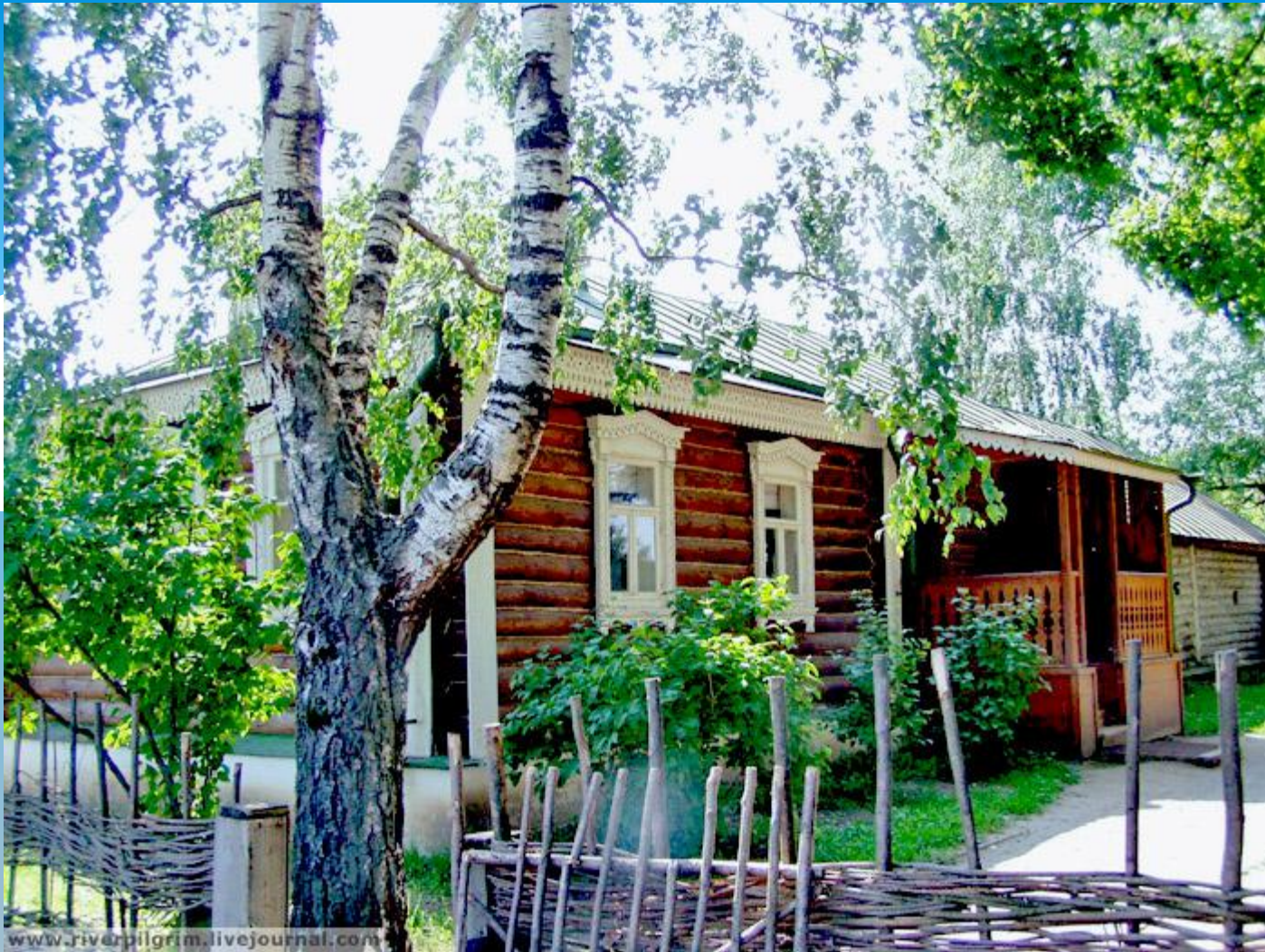
Дом-музей Сергея Есенина