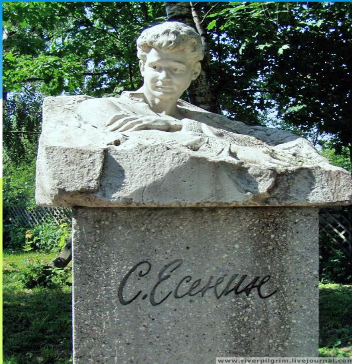
Памятник Сергею Есенину

И в дом его со ставными резными По-прежнему мы входим не дыша.