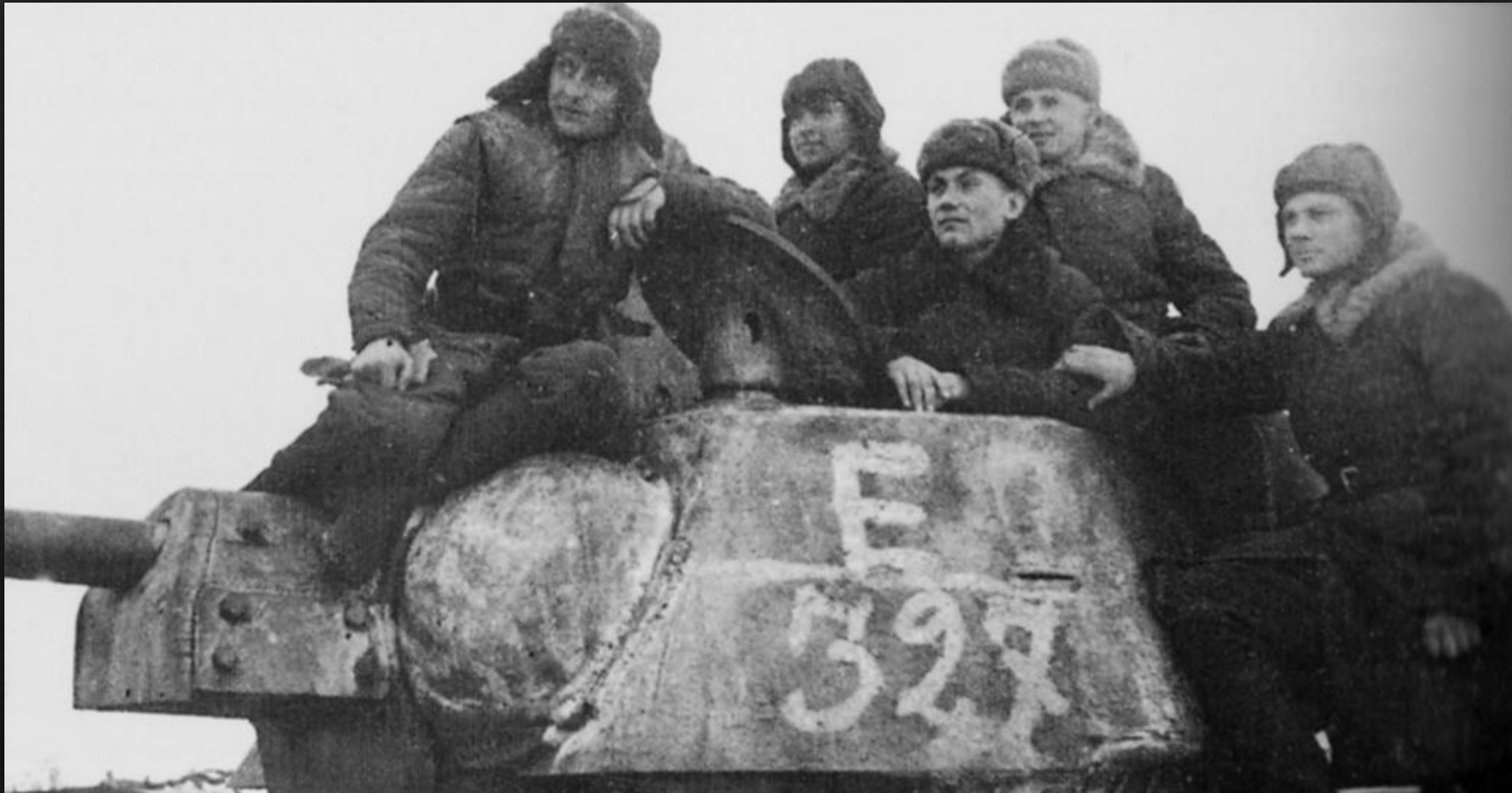
Танкисты 24-го советского танкового корпуса на броне танка Т-34 во время ликвидации окруженной под Сталинградом группировки немецких войск. Декабрь 1942 г.

Планы Вермахта окончательно провалились и стратегическая инициатива наступательного характера сосредоточилась в руках у советского командования.