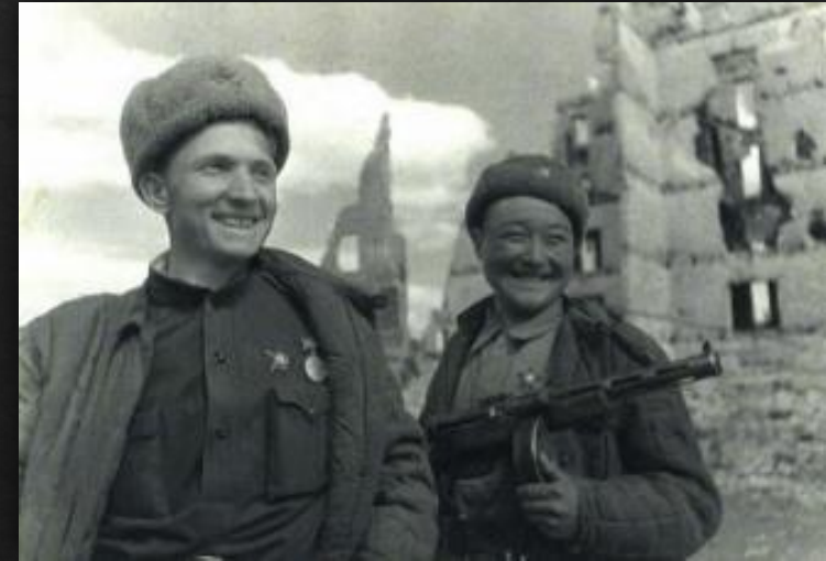
Два советских солдата в Сталинграде, Россия, приблизительно 1942-1943 гг.