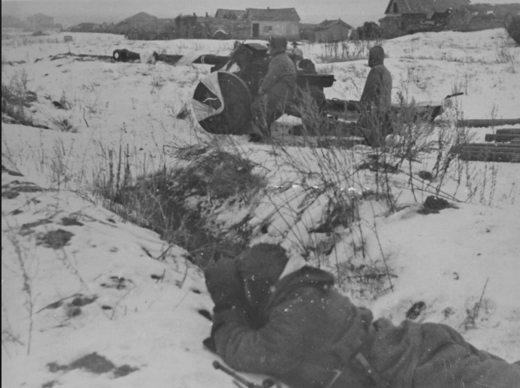
Немецкая 75-мм пушка PaK 40 на окраине деревни под Сталинградом.