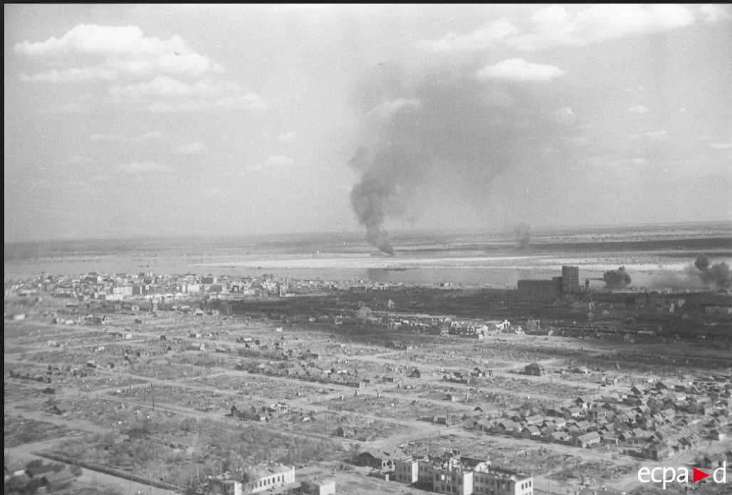
Аэросъемка Сталинграда во время бомбежки. Размещенный на борту Юнкерс Ju-87 «Штука» фотограф делал снимки во время полета бомбардировщика.

В результате массовой атаки была уничтожена 1/4 часть населения города , полностью разрушен его центр.