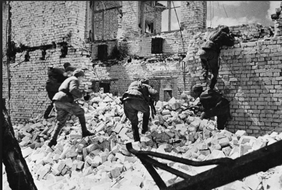
Осень 1942 г. Уличные бои.

Также в ходе наступления было взято в плен пять и разгромлено семь вражеских дивизий.