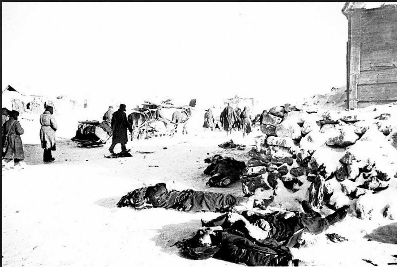
Советские солдаты проходят мимо трупов немецких солдат в Сталинграде. 1943 г.

По количеству суммарных безвозвратных потерь (убитые, умершие от ран в госпиталях, пропавшие без вести) воевавших сторон, Сталинградская битва стала одной из самых кровавых в истории человечества.