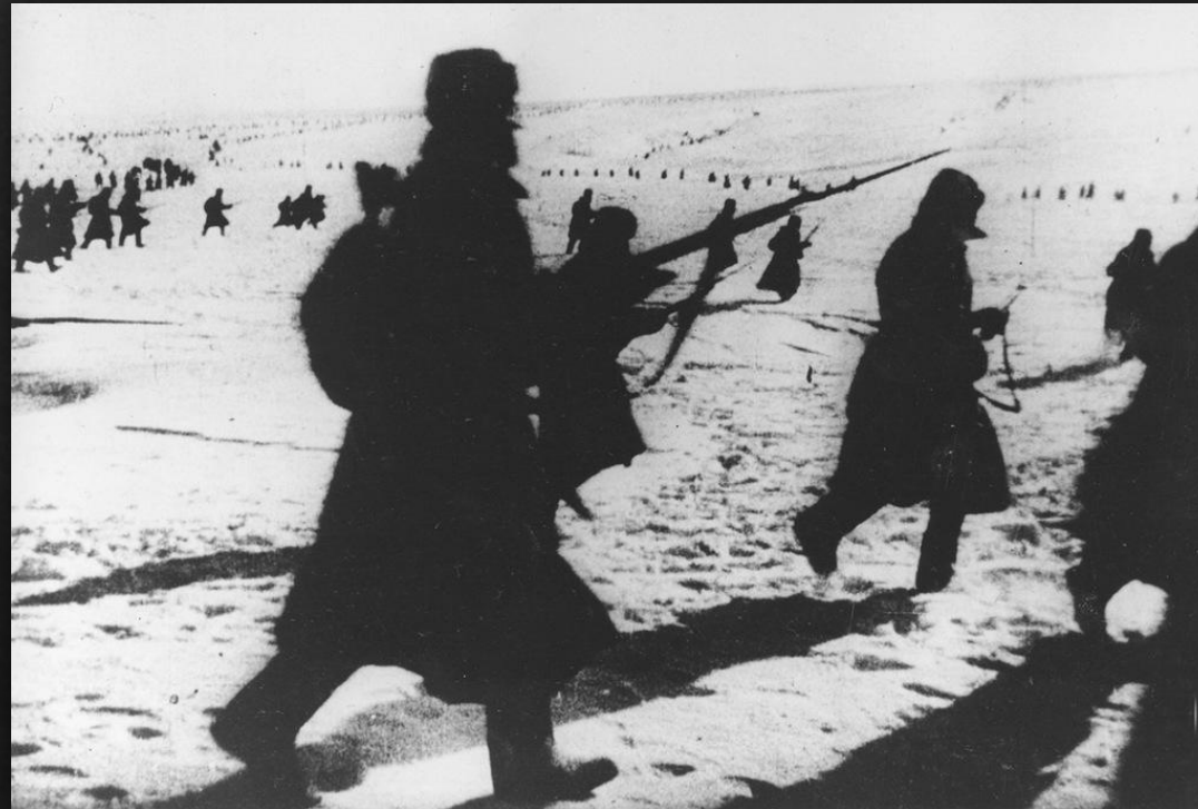
Советская пехота атакует противника под Сталинградом, 1943 г.

Сталинградская битва была одним из важнейших событий Второй мировой войны и наряду со сражением на Курской дуге была переломным моментом в ходе военных действий, после которых немецкие войска потеряли стратегическую инициативу.