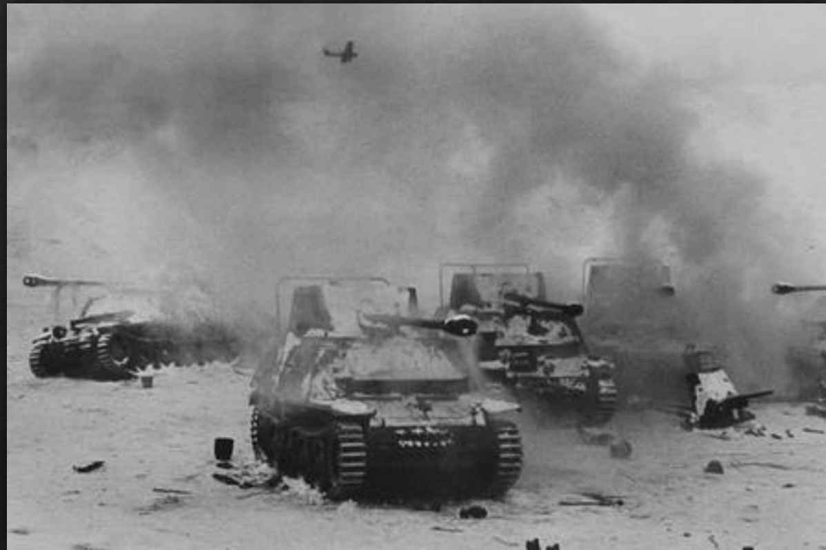
Брошенные немецкие Marder II в Сталинграде, Россия, 1942-1943 гг.

Советские войска заняли аэродром Гумрак, сделав невозможным снабжение окруженной под Сталинградом группировки врага.