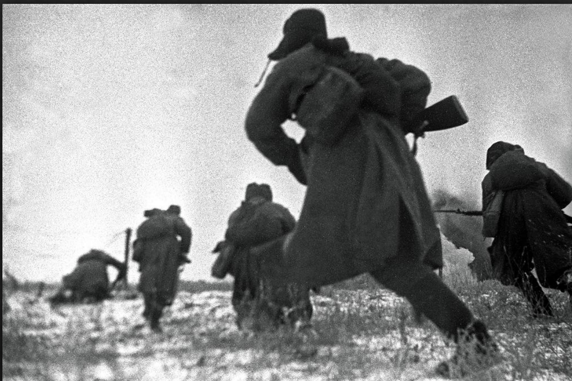
Красноармейцы идут в атаку на врага под Сталинградом. 1942 г.