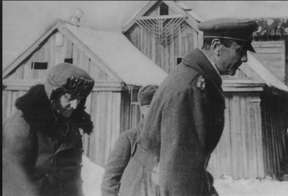
Пленного генерал-фельдмаршала Паулюса и его адъютанта конвоируют в штаб 64-й армии. 31.01.1943 г.

Над площадью Павших борцов Сталинграда было водружено Красное знамя. Генерал-фельдмаршал Ф. Паулюс вместе со штабом пленен в здании центрального Универмага.