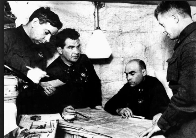
Командный пункт 62-й армии: Крылов, Чуйков, Гуров, Родимцев, декабрь 1942.

План разрабатывался Ставкой Верховного Главнокомандования и Генеральным штабом с сентября 1942 года.