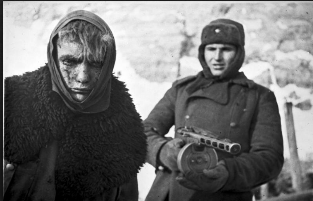
Сталинград, февраль 1943 г.

В подвале механосборочного цеха тракторного завода пленен штаб северной группы войск противника под командованием генерал-полковника К. Штреккера. свыше 40 тыс. солдат и офицеров противника сложили оружие.