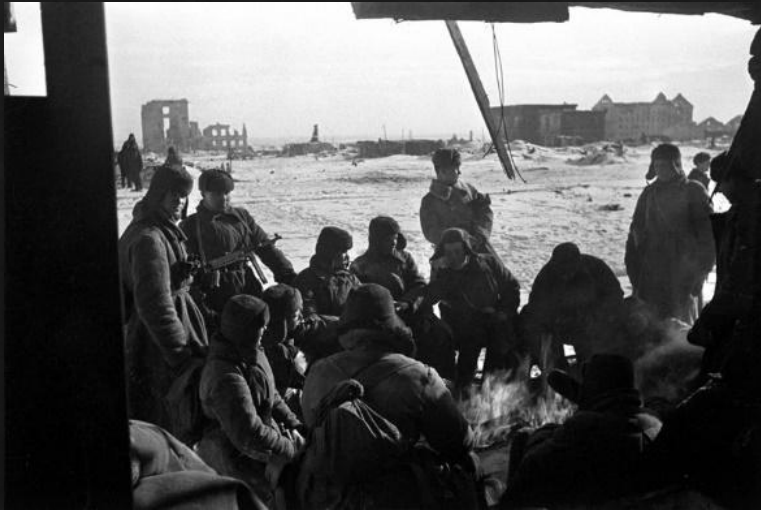
Советские войска, Сталинград, Россия, Январь 1943 г.

Президиум Верховного Совета СССР издал указ «Об учреждении медали «За оборону Сталинграда». Медалью «За оборону Сталинграда» были награждены 760 тысяч человек.