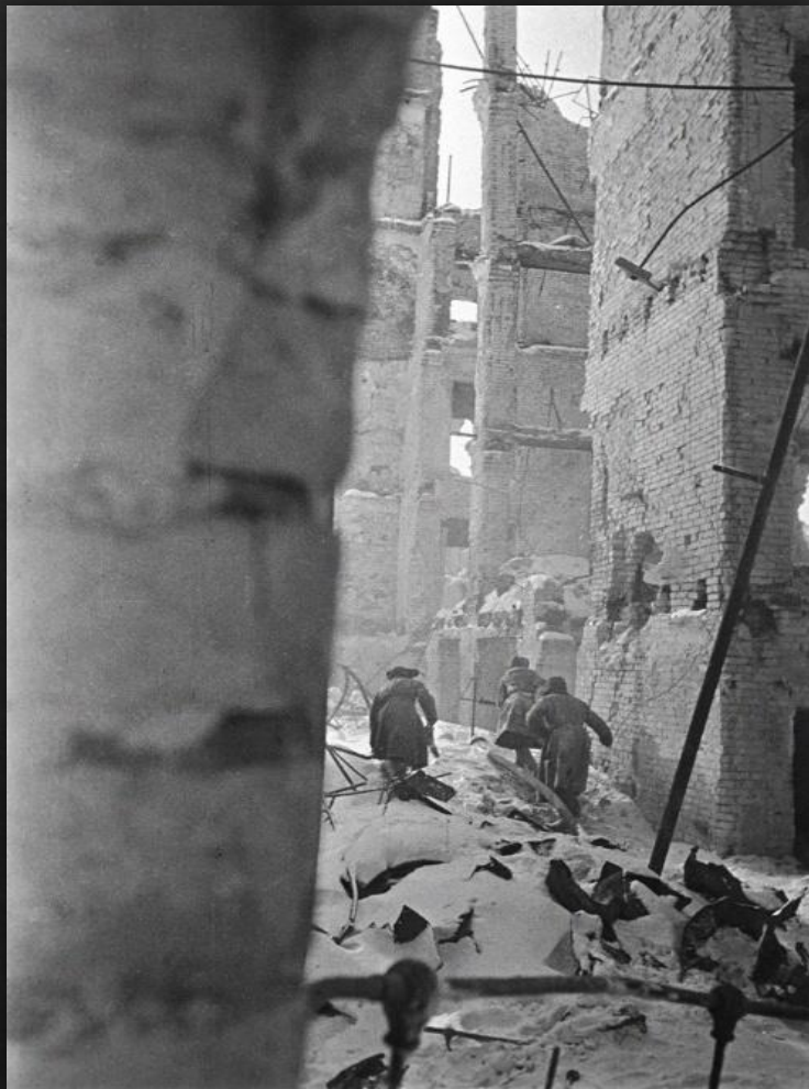
Советские войска, пробивающиеся через руины Сталинграда, Россия, ноябрь 1942г