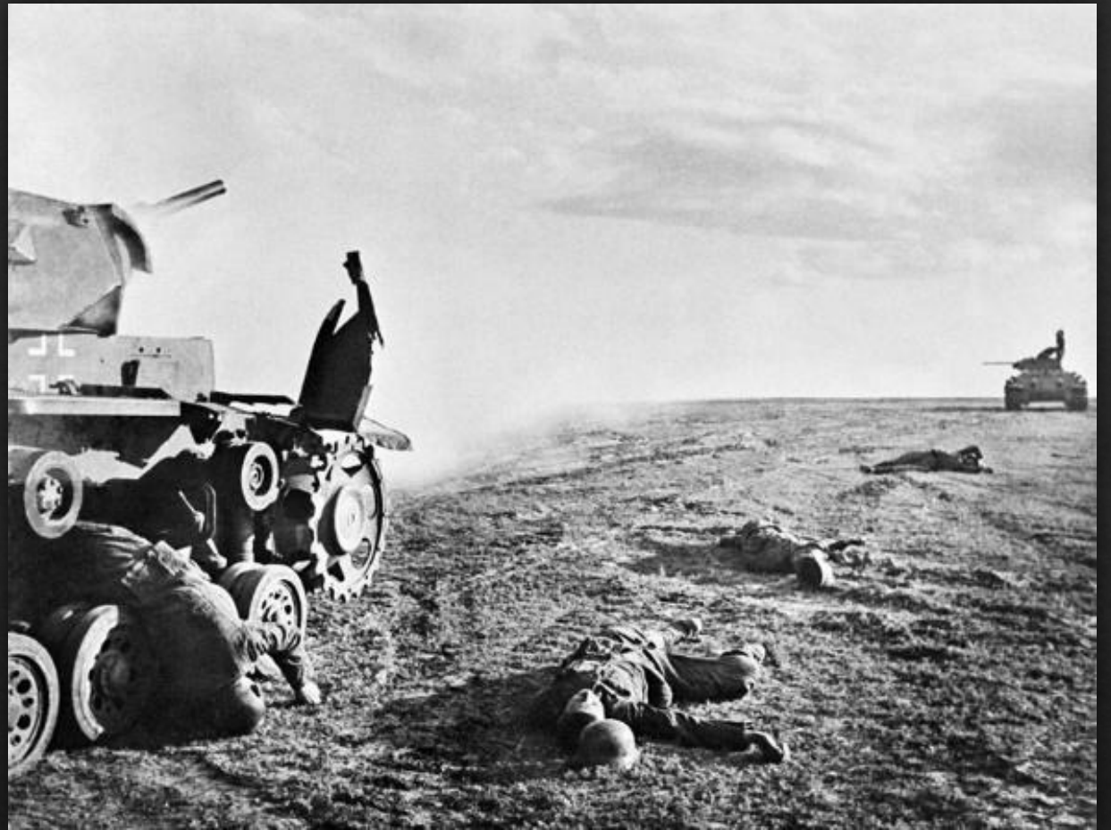
Убитые немецкие танкисты под Сталинградом, Россия, 17 июля 1942 года

Выход приказа № 227 Наркома обороны СССР И. В. Сталина, запрещающий отход войск без приказа (в народе « Ни шагу назад! »)