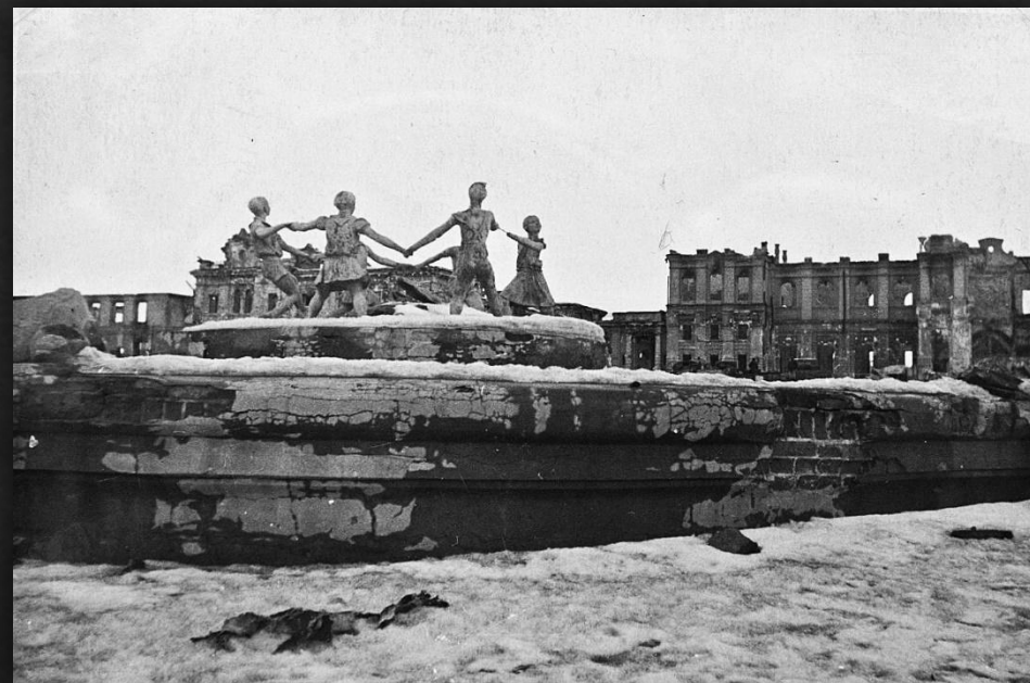
23 августа 1942 года в Сталинграде. «Танцующие дети».