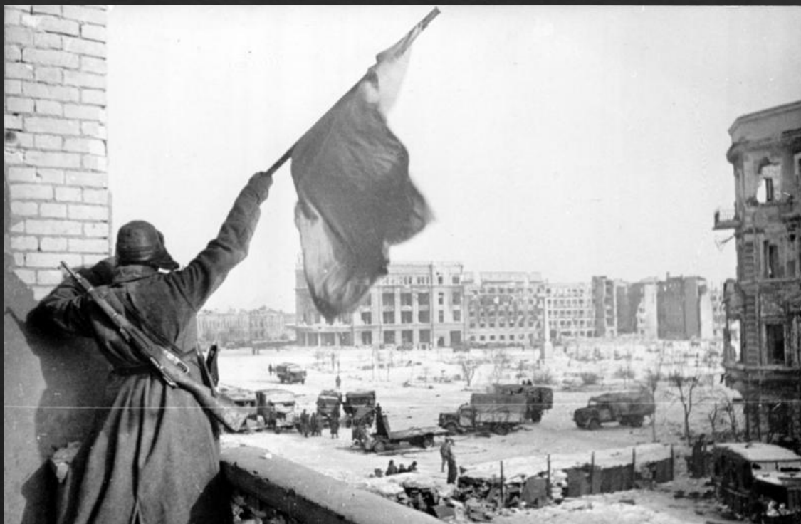
Советский солдат, махающий красным флагом зданию от центральной площади в Сталинграде, Россия, февраль 1943 г.