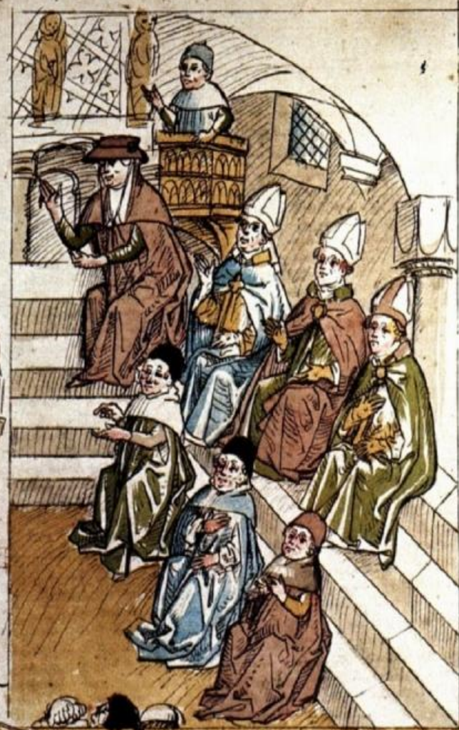
Sitzung des Kirchensynodus in Münster.