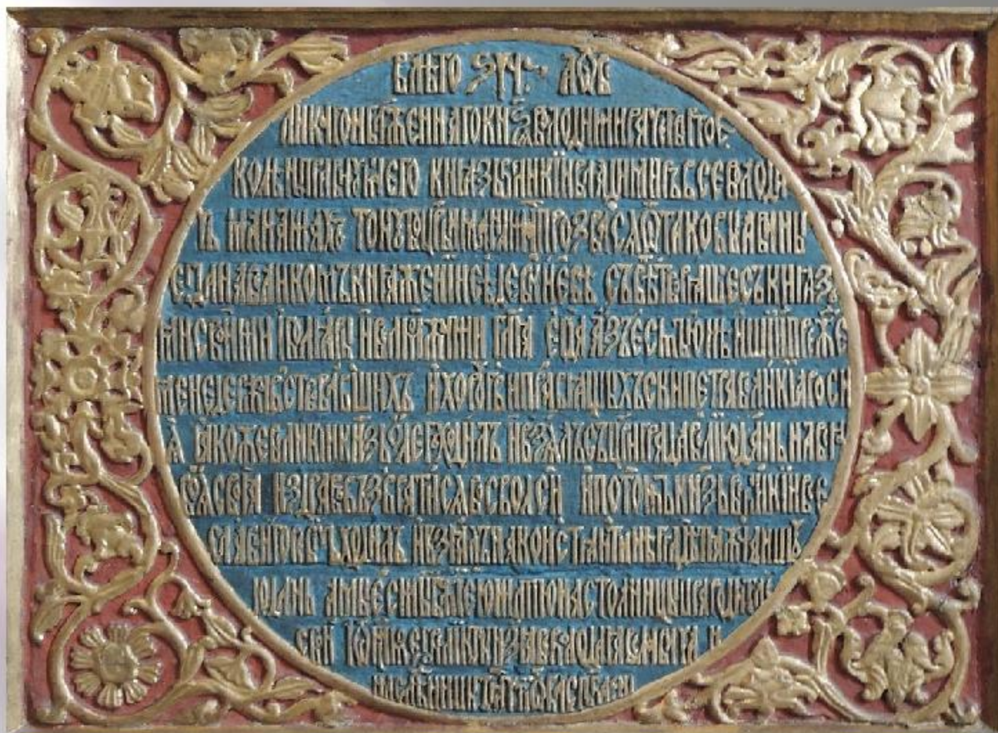
Сказание о князьях Владимирских сюжетами «Сказания» иллюстрированы 12 панелей Мономахова трона в Успенском соборе