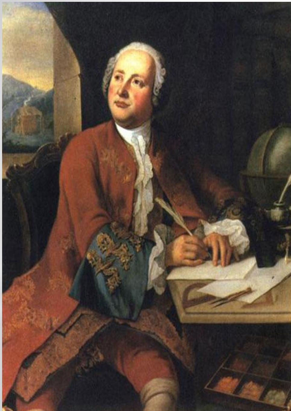
Ломоносов Михаил Васильевич (1711-1765)