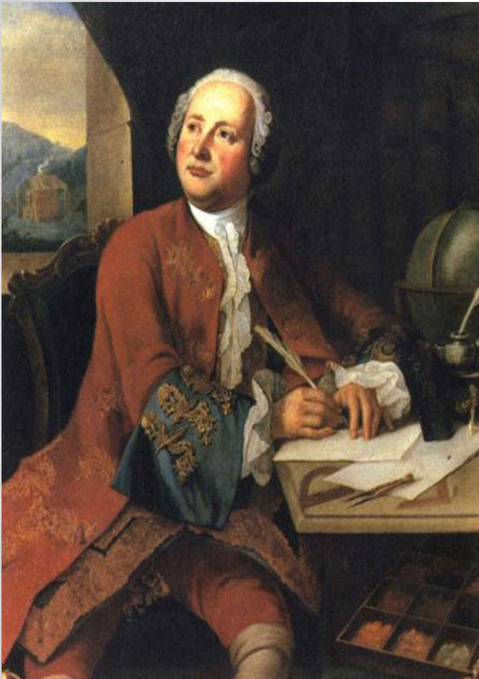
Ломоносов Михаил Васильевич (1711-1765)