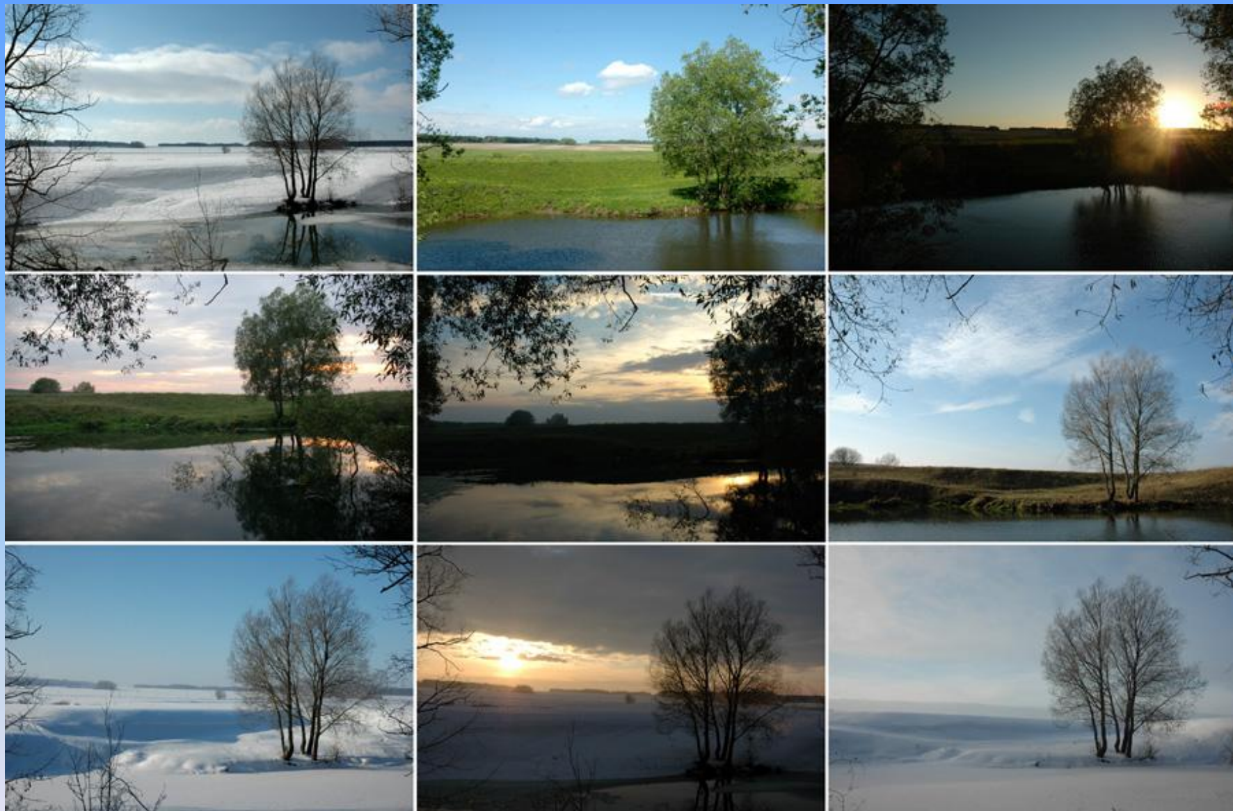
Смена времён года