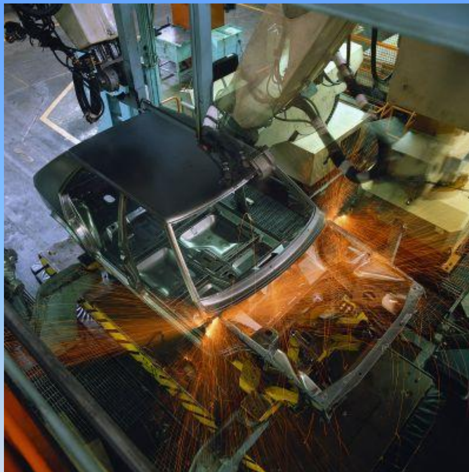
Конвейер изготовления автомашин