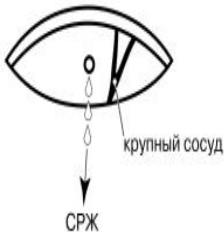
Рис. 4.12. Склеротомия для удаления субретинальной жидкости