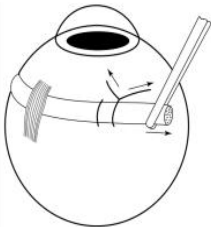
Рис. 4.20. Натяжение пробки в момент завязывания шва