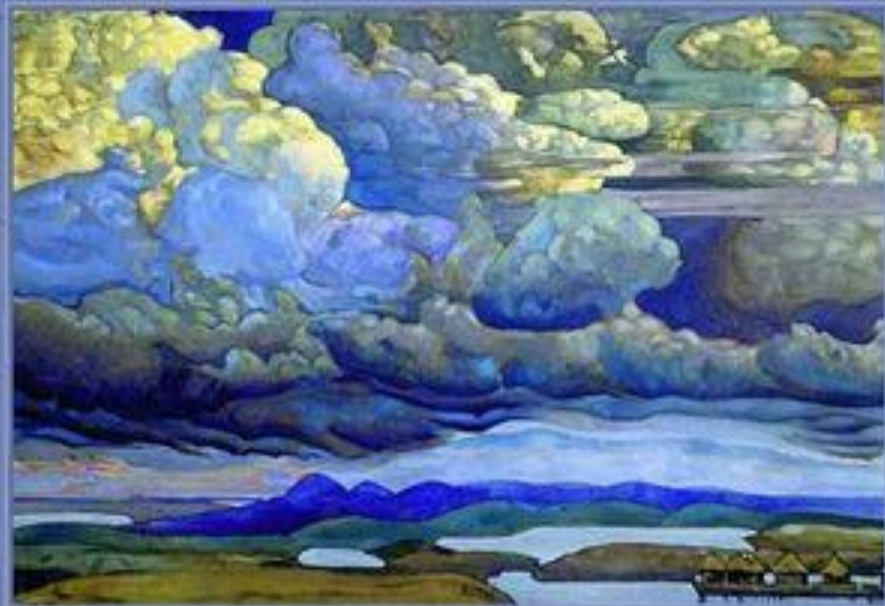
Клод Дебюсси. Триптих «Ноктюрны»

Ноктюрн в переводе с латинского значит ночной . Ноктюрнами называют пьесы, предназначенные для ночного музицирования под открытым небом. Или же сочинения, которые передают настроения человека, находящегося под впечатлением образов ночи.