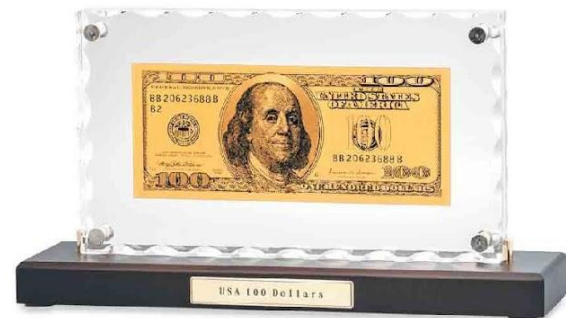
Арт. НВ-079 "Банкнота 100 USD" в стекле