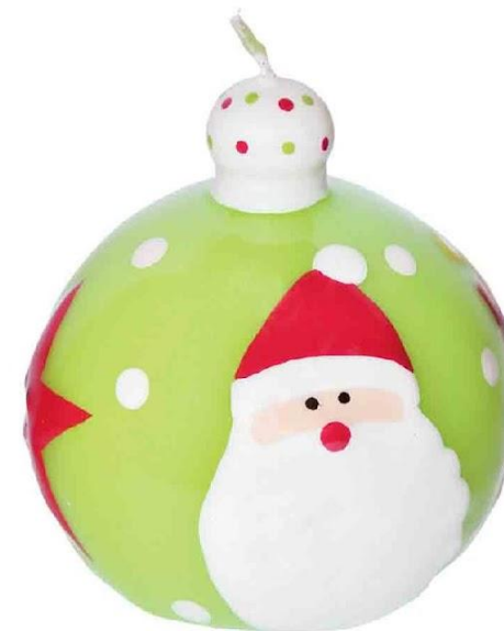
Арт. 2225 Свеча "Шар новогодний"