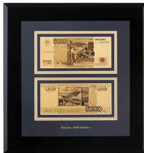
Арт. НВ-144_TG "Банкнота 5000 рублей"