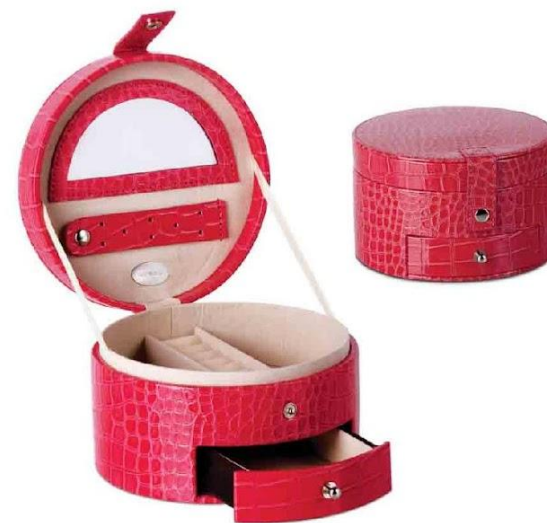
Арт. 5029 Шкатулка для драгоценностей