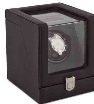
Арт. 9503 Шкатулка для часов с подзаводом