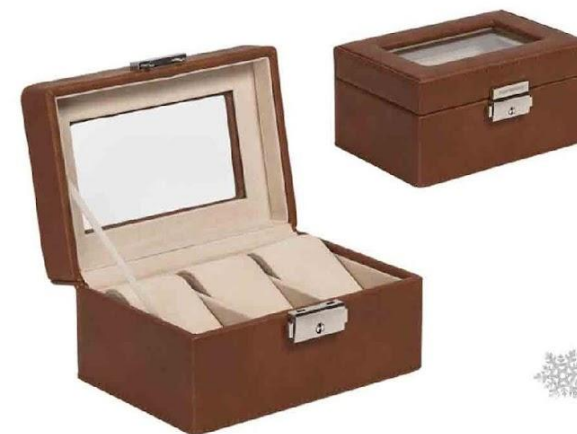
Арт. 5040 Шкатулка для часов