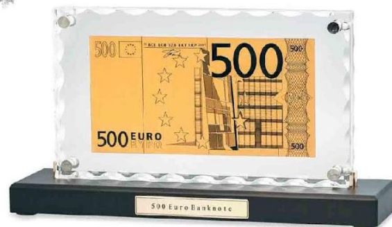
Арт. НВ-059 "Банкнота 500 Euro" в стекле