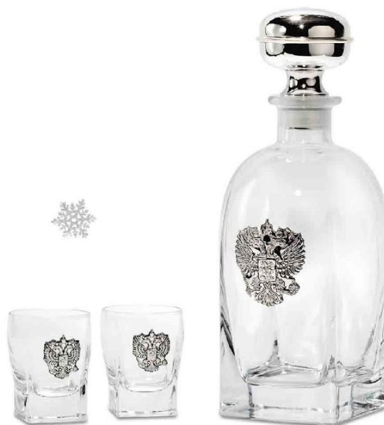
Арт. 2963 Набор для водки "Russia"