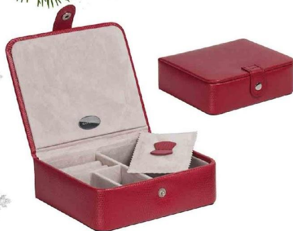
Арт. 5039-4 Шкатулка для драгоценностей