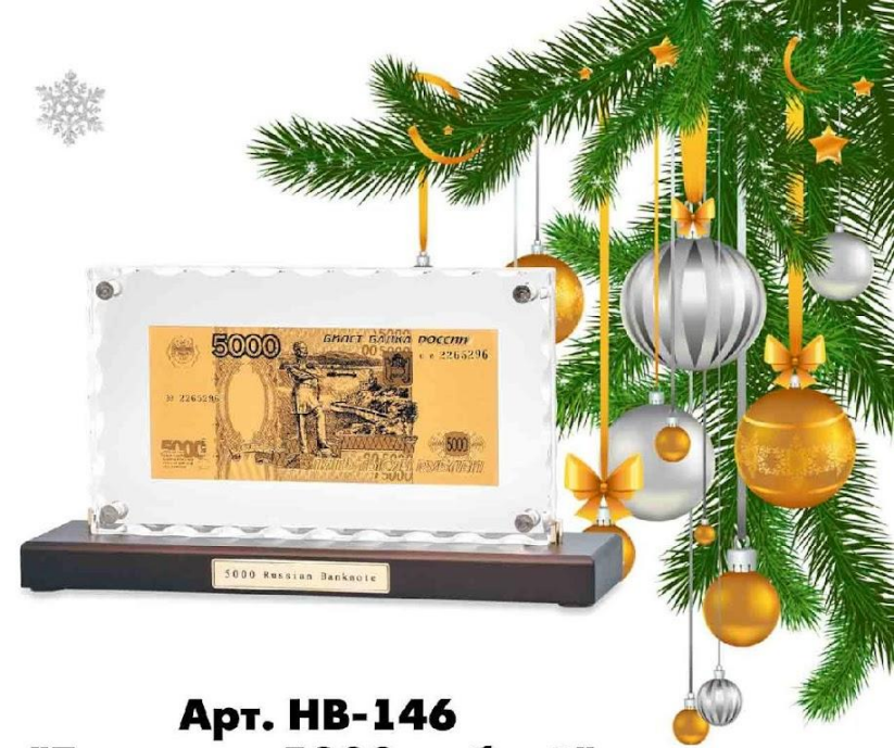
Арт. НВ-146 "Банкнота 5000 рублей" в стекле