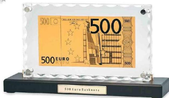
Арт. НВ-059 "Банкнота 500 Euro" в стекле