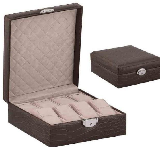
Арт. 5015 Шкатулка для часов