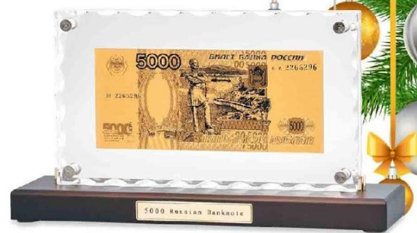
Арт. НВ-146 "Банкнота 5000 рублей" в стекле