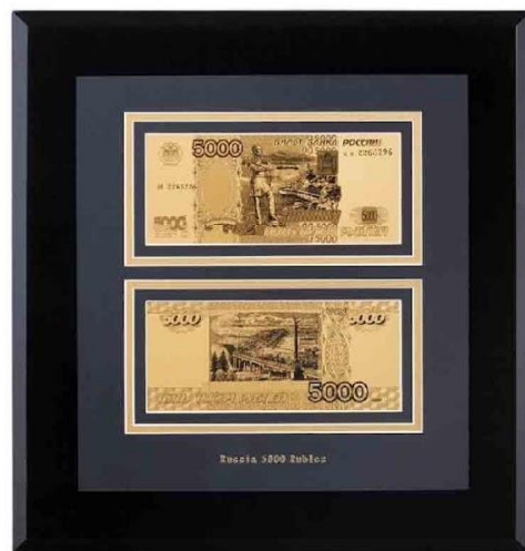
Арт. НВ-144_TG "Банкнота 5000 рублей"