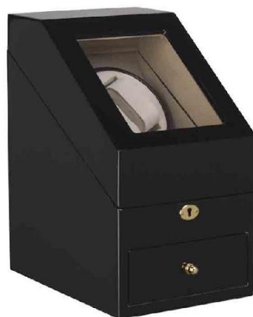
Арт. 9521 Шкатулка для часов с подзаводом