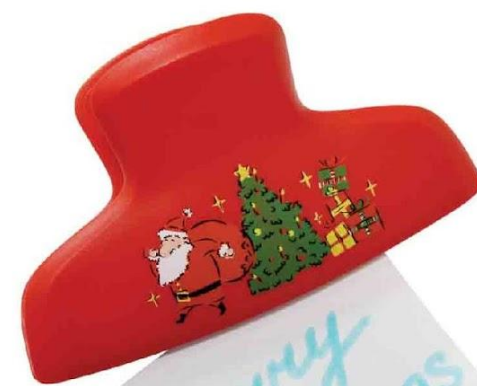
Арт. 9400 Магнит-клип новогодний с музыкой