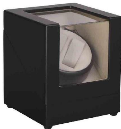
Арт. 9522 Шкатулка для часов с подзаводом

Самая оригинальная новогодняя традиция украшения новогодней елки в Испании, которую украшают множеством сладостей. Это могут быть конфеты, фигурки из сладкого теста, мармелад.