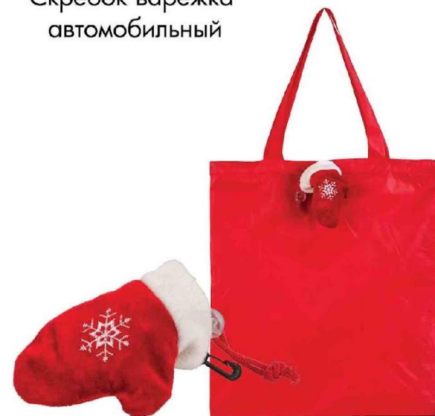
Арт. 3125 Сумка для покупок "Рукавичка" новогодняя