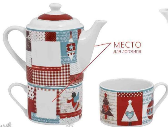
Арт. 8909 Набор чайный "Новогодняя история"