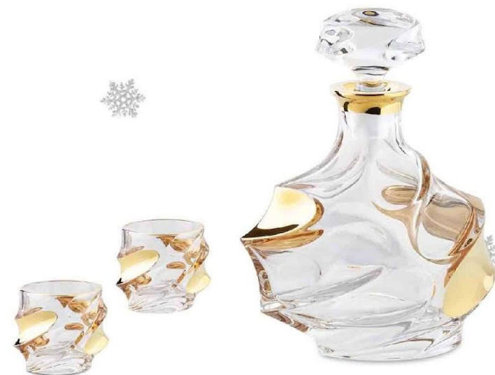
Арт. 73162 Набор для виски