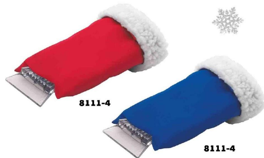
Арт. 8111 Скребок-варежка автомобильный