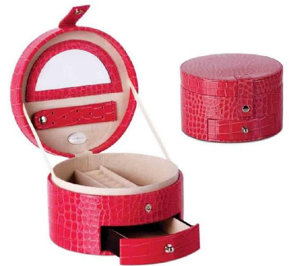
Арт. 5029 Шкатулка для драгоценностей