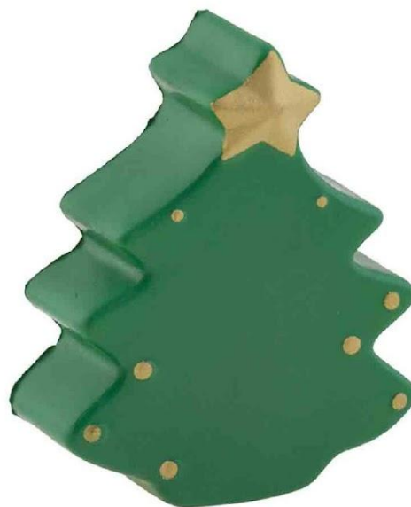
Арт. 5315 Антистресс "Елка"