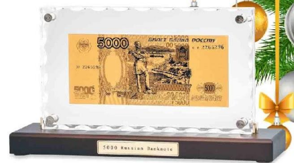
Арт. НВ-146 "Банкнота 5000 рублей" в стекле