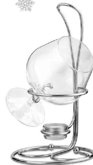
Арт. 2056400 Коньячница "Mosso"