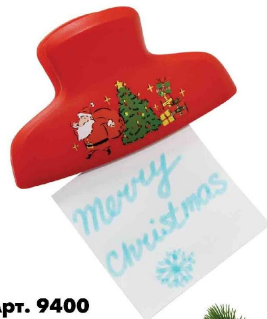
Арт. 9400 Магнит-клип новогодний с музыкой