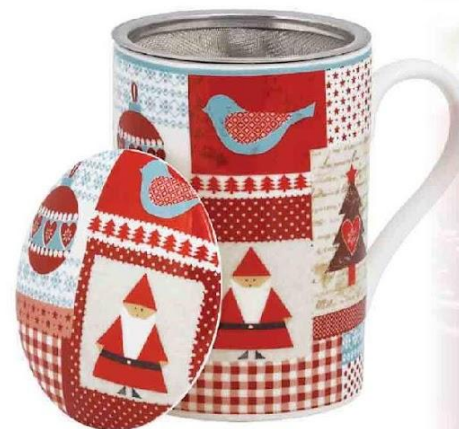
Арт. 8910 Кружка "Зимняя сказка"