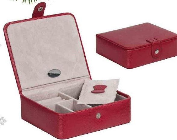
Арт. 5039-4 Шкатулка для драгоценностей