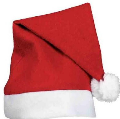
Арт. 1336 Колпак новогодний