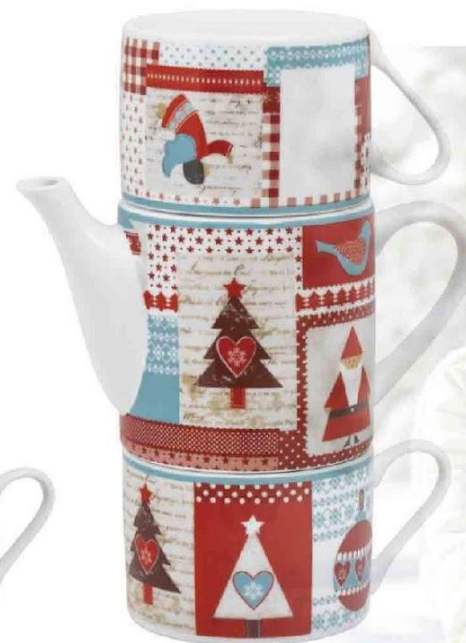
Арт. 8909 Набор чайный "Новогодняя история"