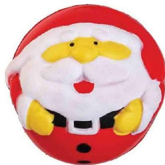
Арт. 6313 Антистресс "Дед Мороз"