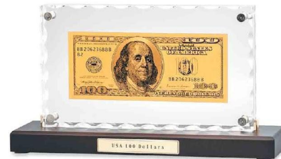
Арт. НВ-079 "Банкнота 100 USD" в стекле