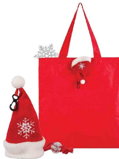
Арт. 3126 Сумка для покупок "Колпак" новогодняя