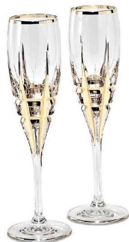
Арт. 2856 Набор для шампанского