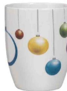
Арт. 8908 Кружка "Волшебный шар"