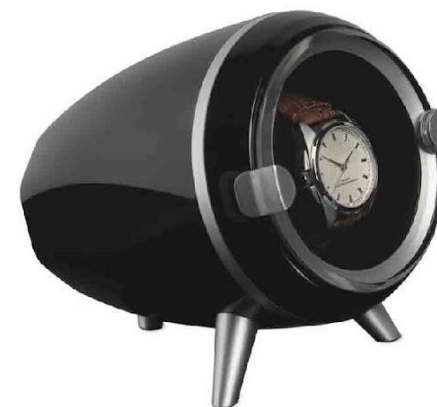
Арт. JBW090BK Шкатулка для часов с подзаводом