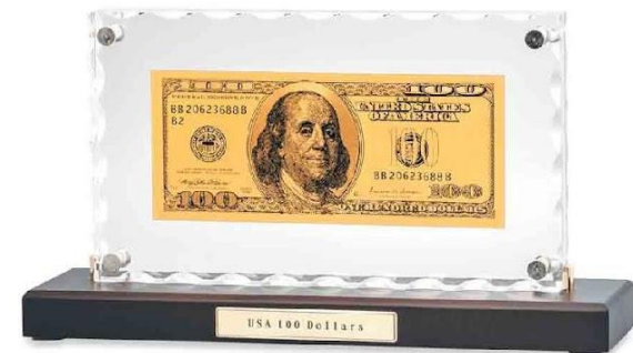
Арт. НВ-079 "Банкнота 100 USD" в стекле