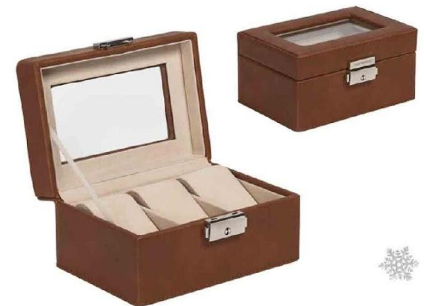
Арт. 5040 Шкатулка для часов