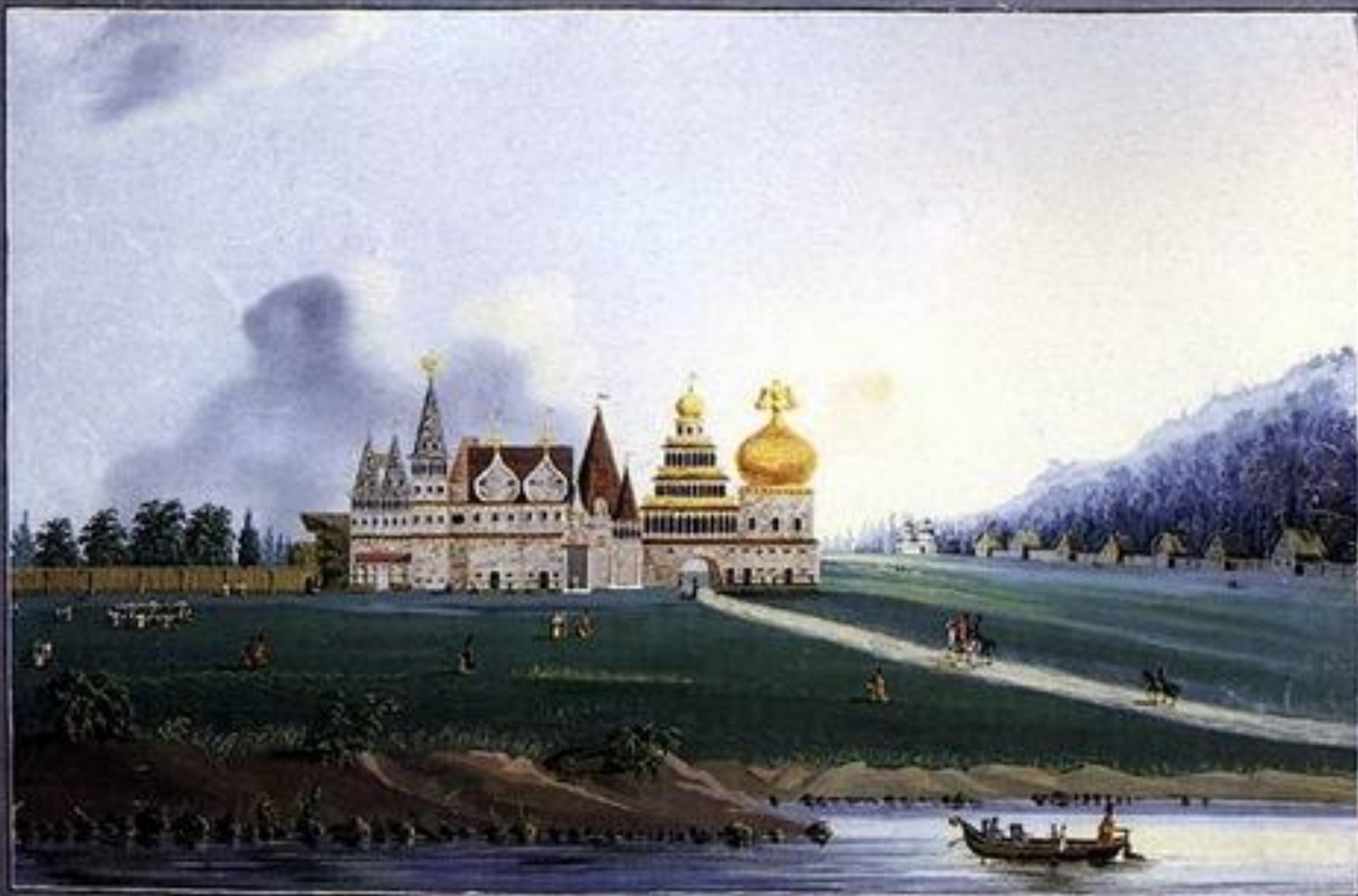
Paesaggio di un paese di Casa Reale, con un grande palazzo e una chiesa.