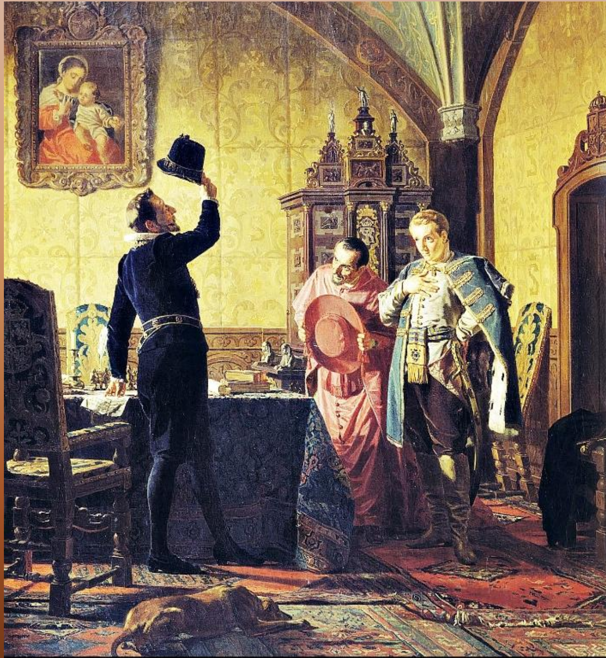
Н. Неврев Присяга Лжедмитрия I польскому королю Сигизмунду III на введение в России католицизма.