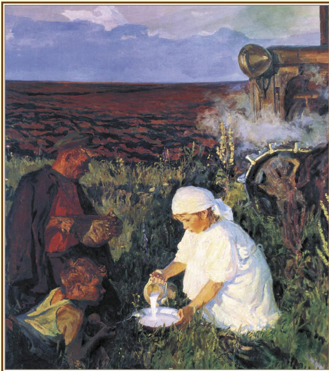
А. Пластов. Ужин тракториста