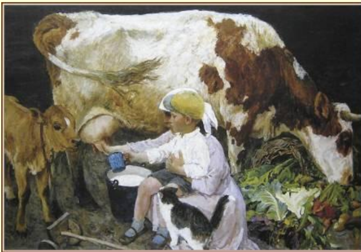
А. Пластов. Кружка молока