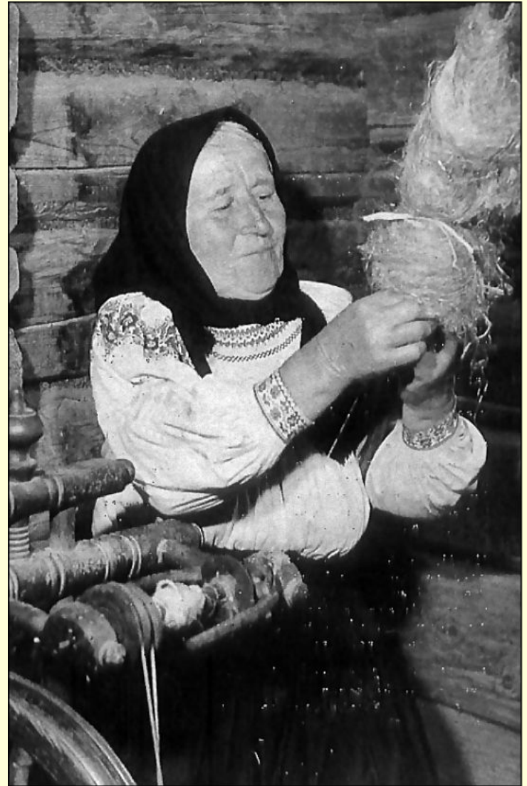
За прялкой. Старинная фотография