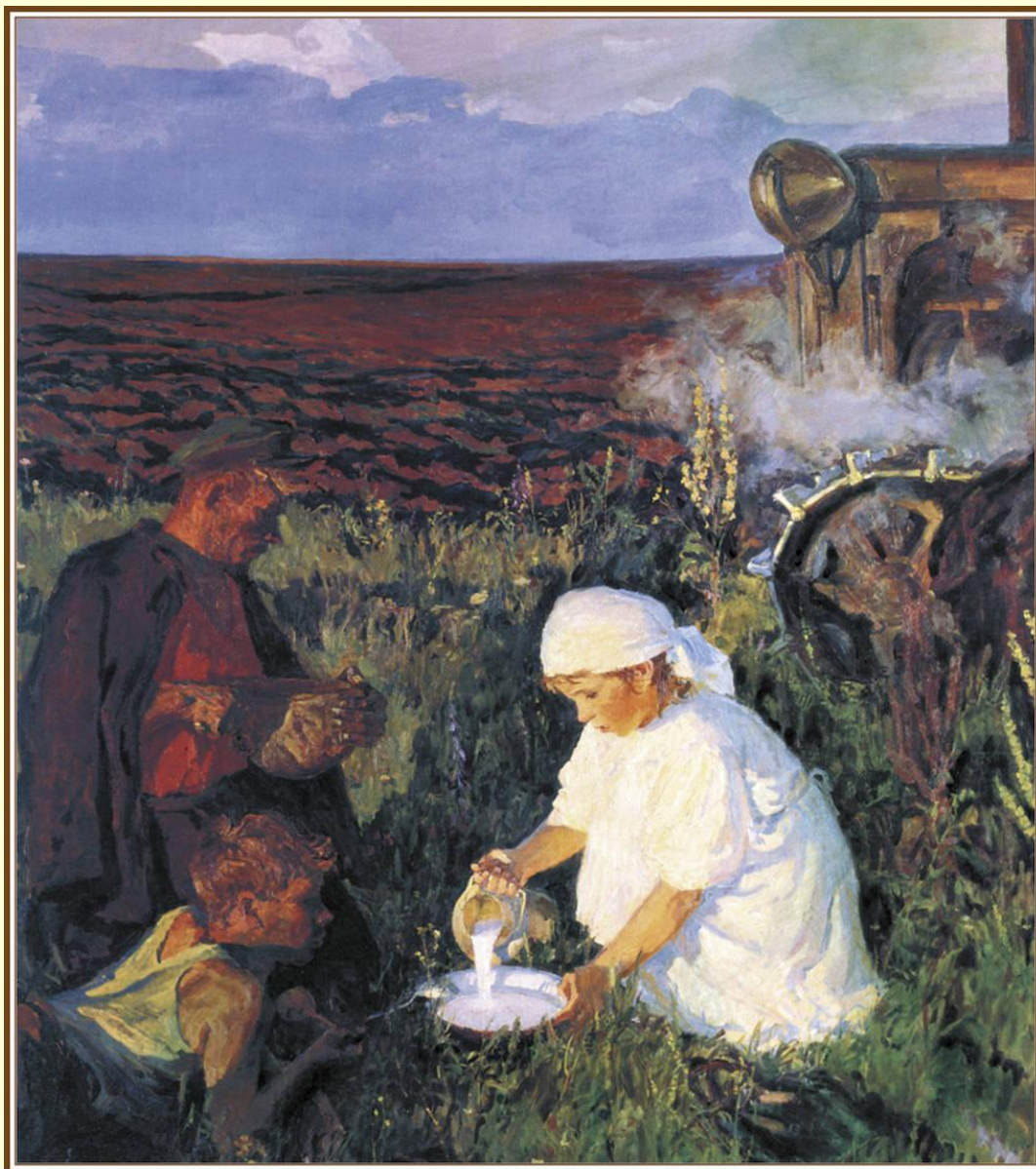
А. Пластов. Ужин тракториста