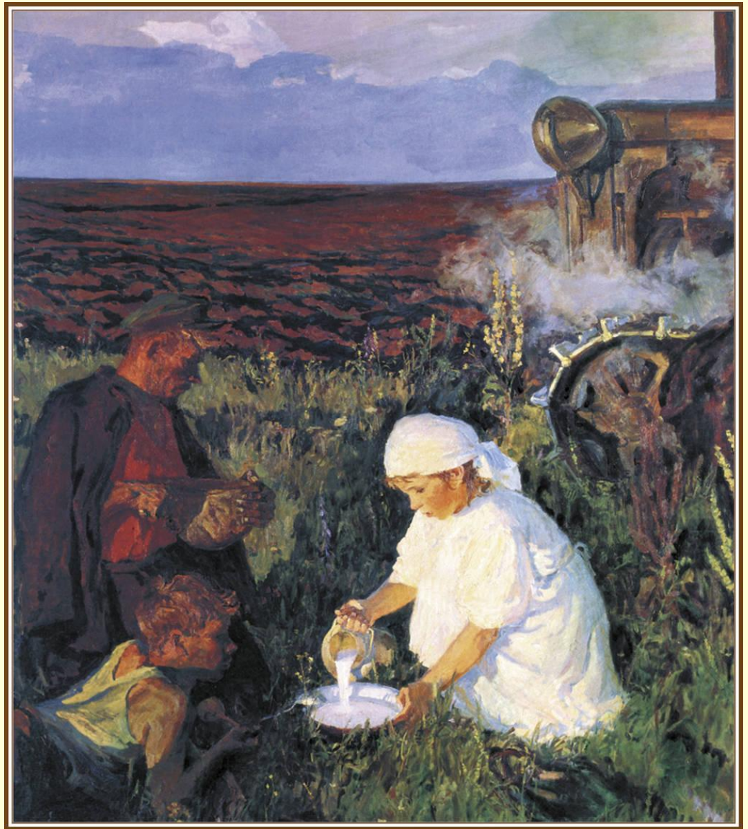
А. Пластов. Ужин тракториста