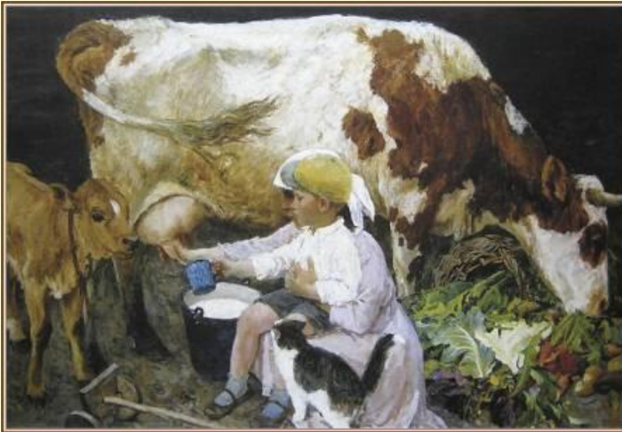
А. Пластов. Кружка молока