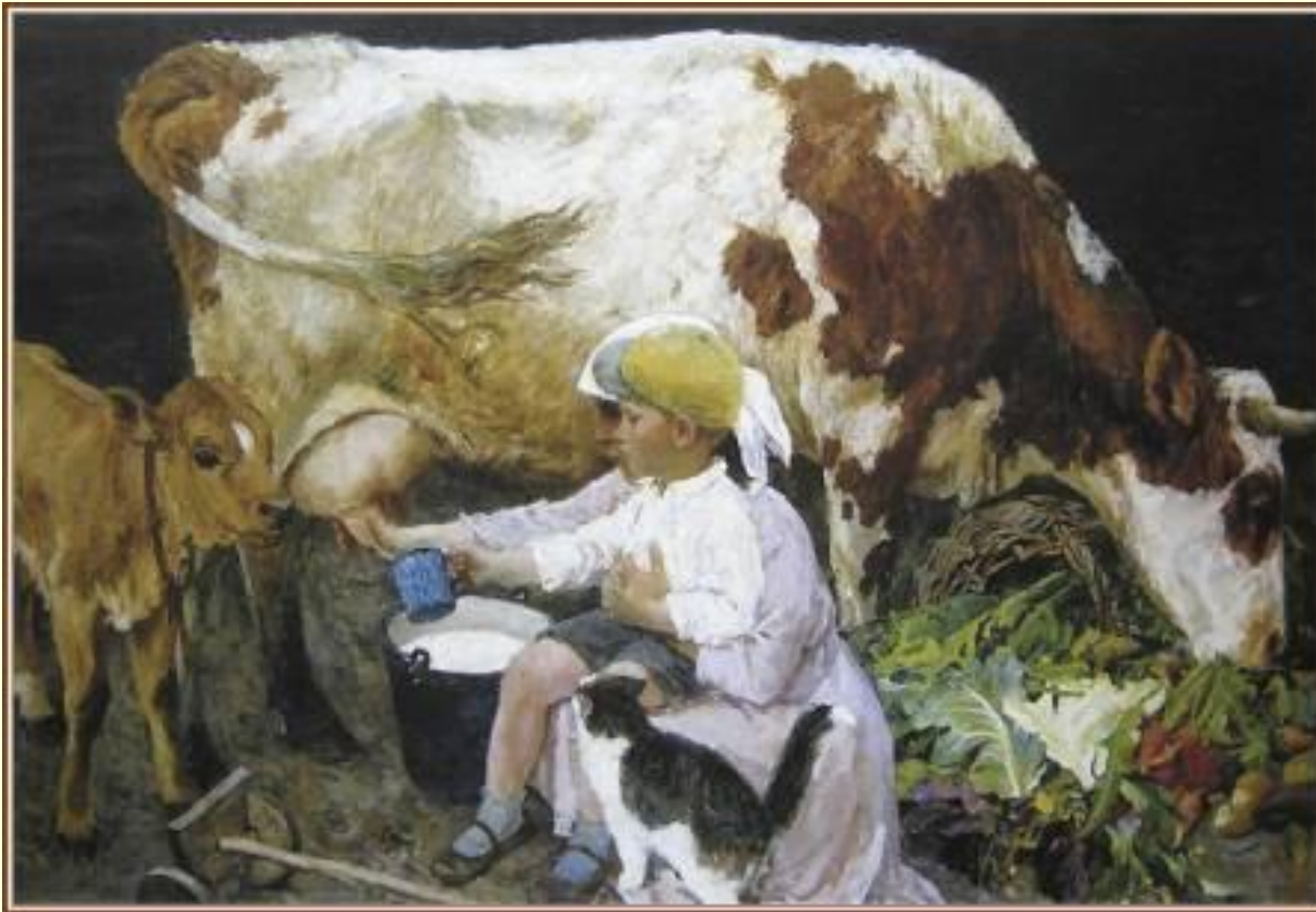
А. Пластов. Кружка молока