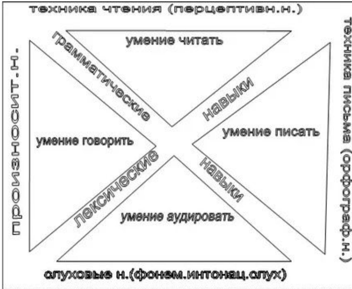
СХЕМА УМЕНИЙ И НАВЫКОВ ПО С.Ф. ШАТИЛОВУ