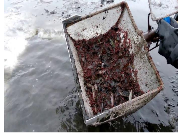
Добыча мотыля зимой

Большинство комаров зимуют в стадии яйца. В такой стадии комары становятся наиболее стойкими по отношению к неблагоприятным факторам среды и прежде всего к низким зимним температурам. А некоторые виды в стадии личинки, как например, комар-пискун. Его личинка – мотыль зиму проводит на дне водоема, зарывшись в ил.