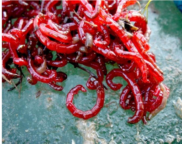
Личинка комара- пискуна называется МОТЫЛЬ