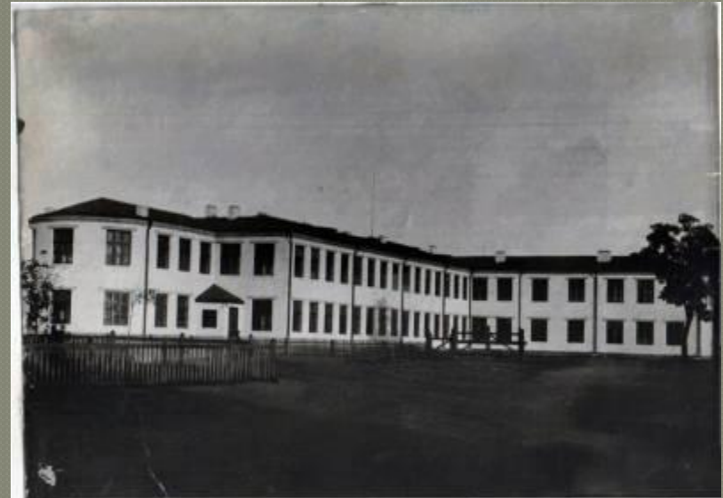
церковно – приходська однокласна школа