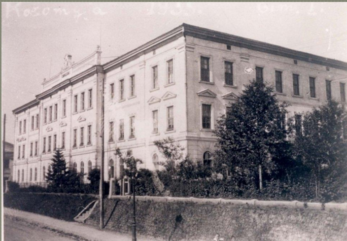
Польська державна гімназія м. Коломия