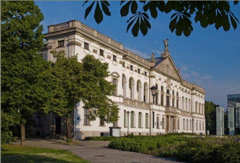
1928 - Національна бібліотека у Варшаві(головний корпус)

У 1928 р. був заснований спеціальний Фонд наукової культури для допомоги вченим.