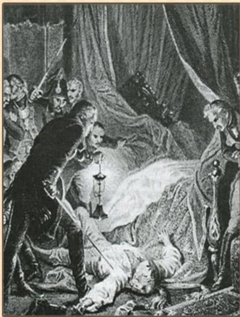
СМЕРТЬ ПАВЛА I. Гравюра Утвайта по рис. Фламппото. Первая половина XIX века.

В ночь на 12 марта 1801 г. заговорщики, отстранив охрану, проникли в Михайловский замок и ворвались в покои Павла. Возможно, они договаривались лишь арестовать его, но возникла ссора, кто-то (вероятно, Н.Зубов) ударил Павла золотой табакеркой в висок, остальные душили его шарфом. Официальная версия: император скончался от апоплексического удара.