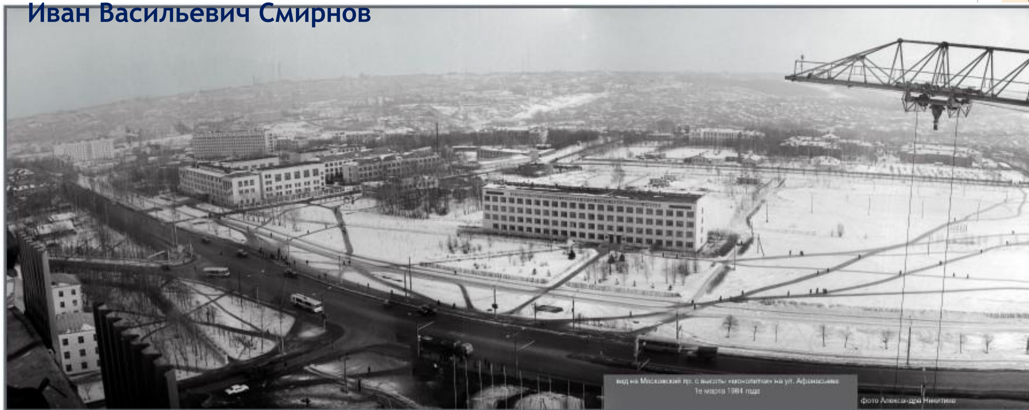
вид на Московский пер. с высоты экзоскелетов на ул. Афанасьева Тяжелов 1984 года