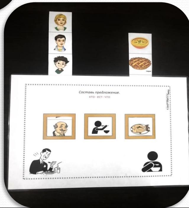
КТО – ЕСТ - ЧТО