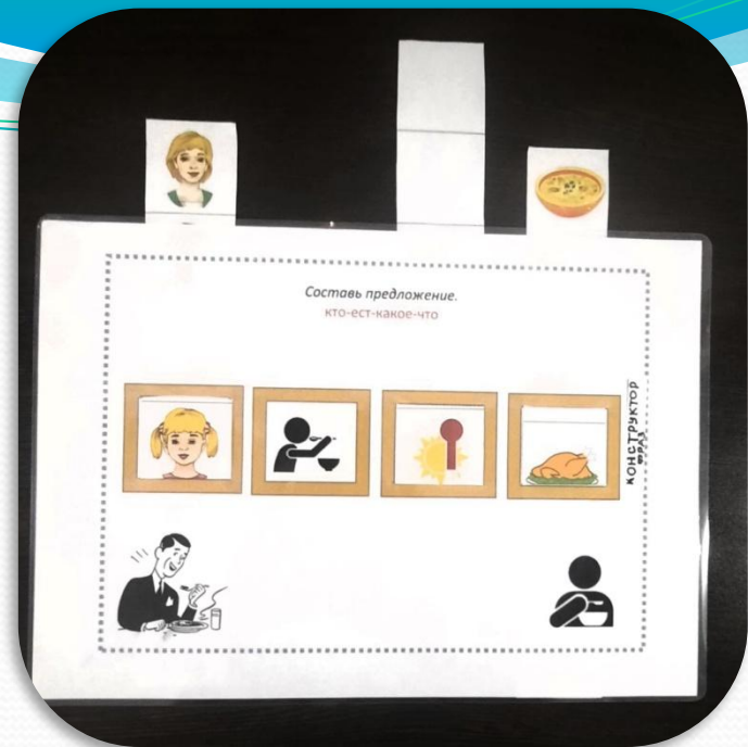
КТО – ЕСТ – КАКОЕ - ЧТО