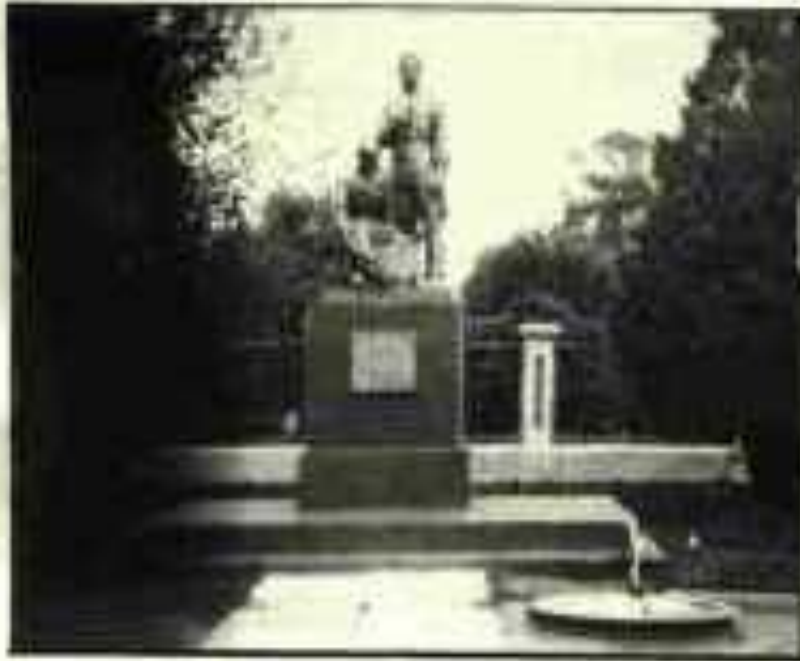
8. Фотооснимок захоронения