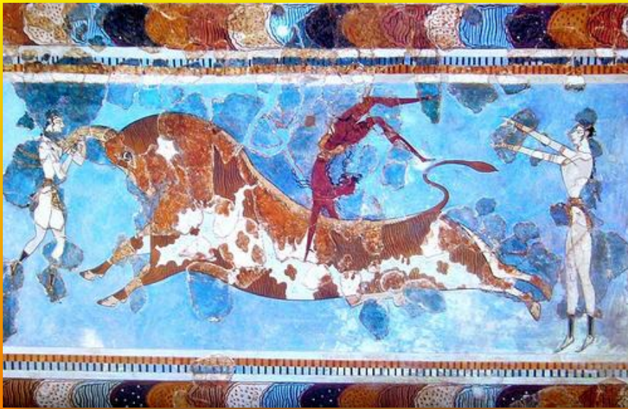
Игры с быком (роспись дворца в Кноссе)

Состязания с участием быка известны с древнейших времен.