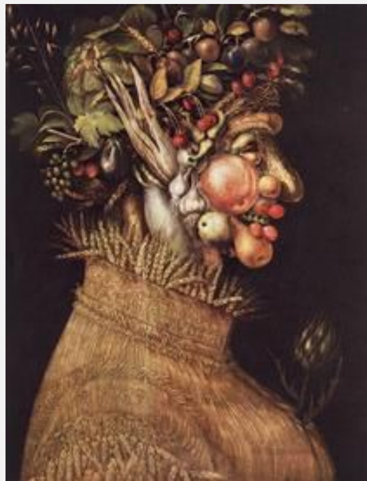
Джузеппе Арчимбольдо «Лето» (из цикла «Времена года») 1563