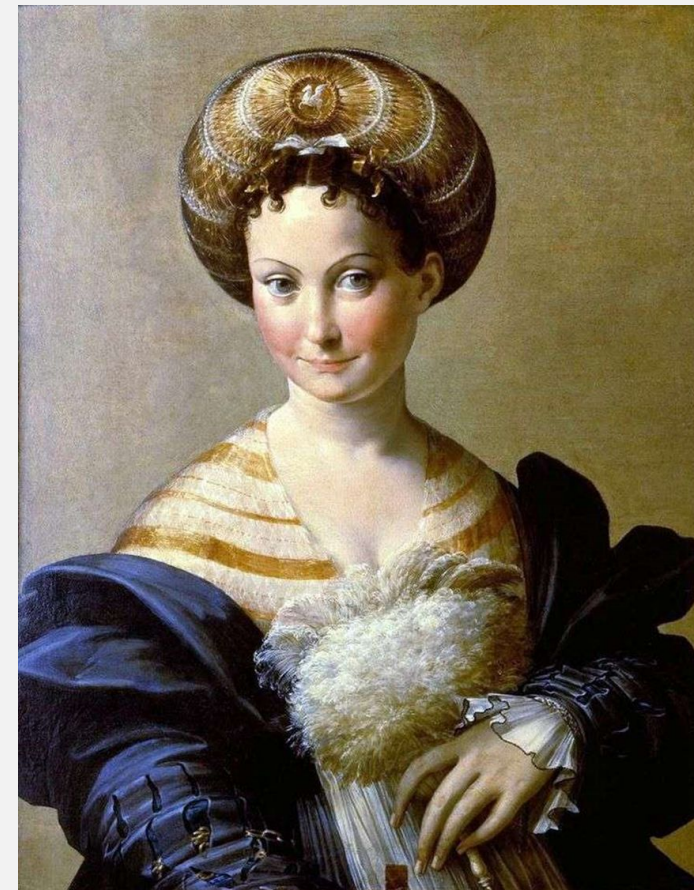
Франческо Пармиджанино «Турецкая невольница» 1530-1531