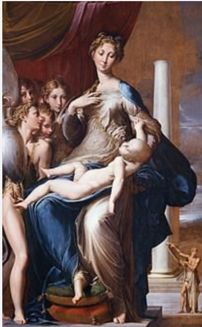
Франческо Пармиджанино «Мадонна с длинной шеей» 1534-1540