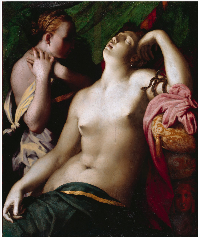
Россо Фьорентино «Пир и смерть Клеопатры» 1525