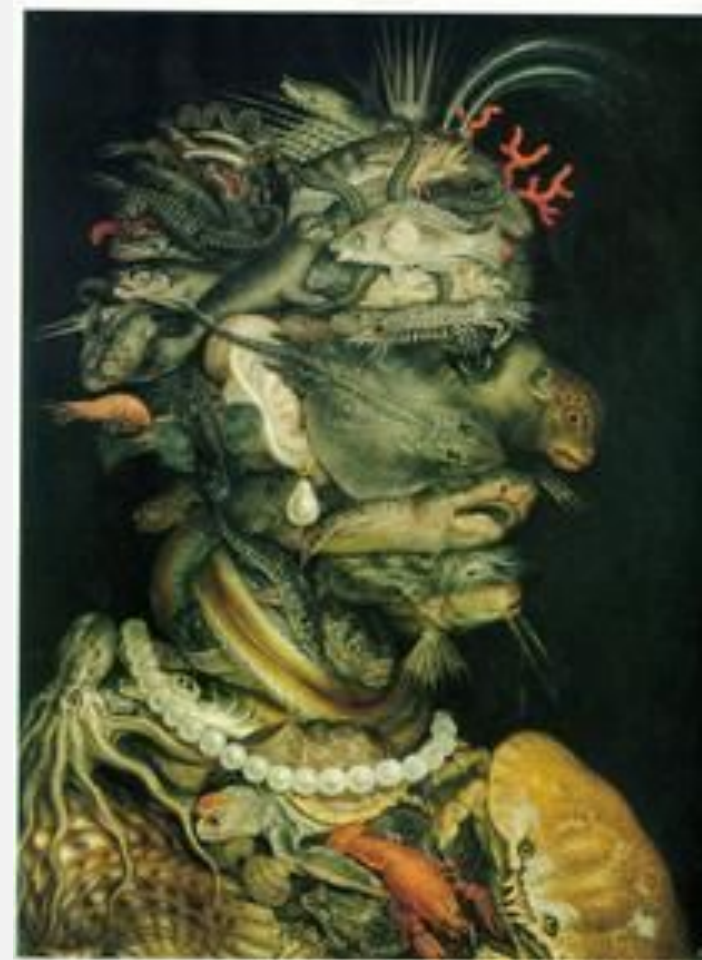
Джузеппе Арчимбольдо «Вода» (из цикла «стихии») 1566