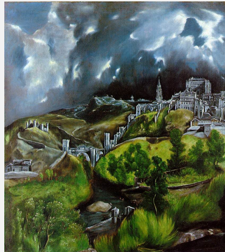
«Вид Толедо» 1598-1599