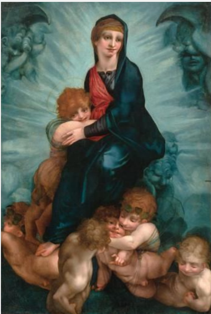
Россо Фьорентино «Мадонна во славе» 1519-1523