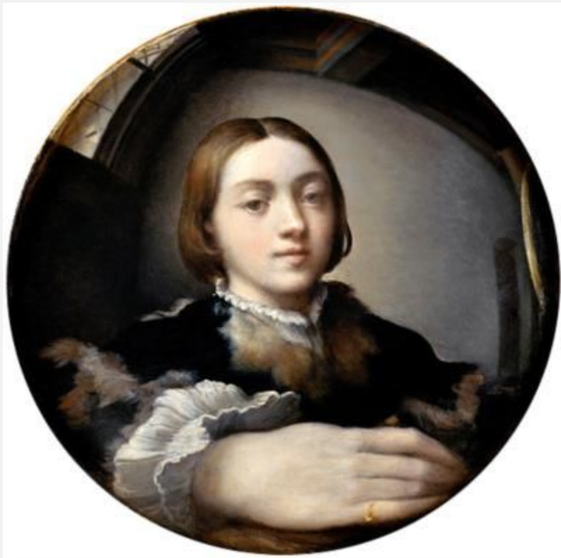
Франческо Пармиджанино «Автопортрет через линзу» 1524