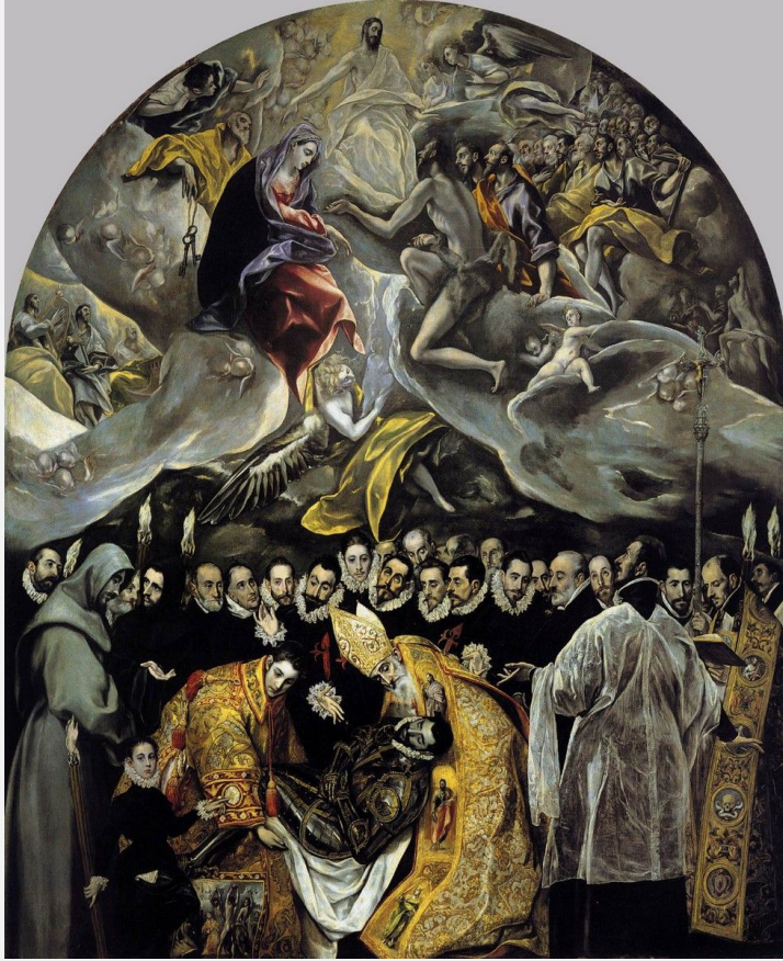
«Погребение графа Оргаса» 1586-1588