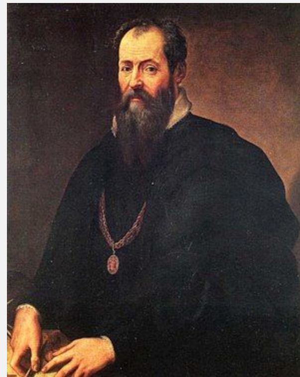
Дж. Вазари, Автопортрет