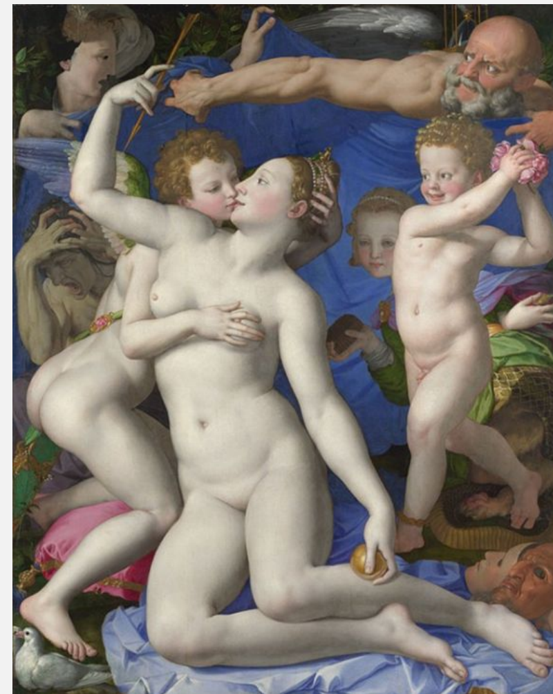
Аньола Бронзино «Аллегория с Венерой и Амуром» 1546