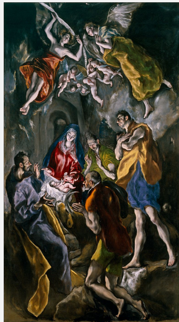
«Поклонение пастухов» 1612-1614