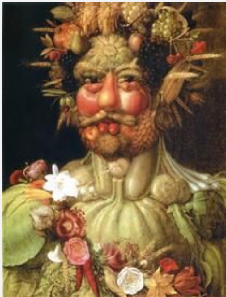
Джузеппе Арчимбольдо «Вертумнус» (Император Рудольф II) 1591