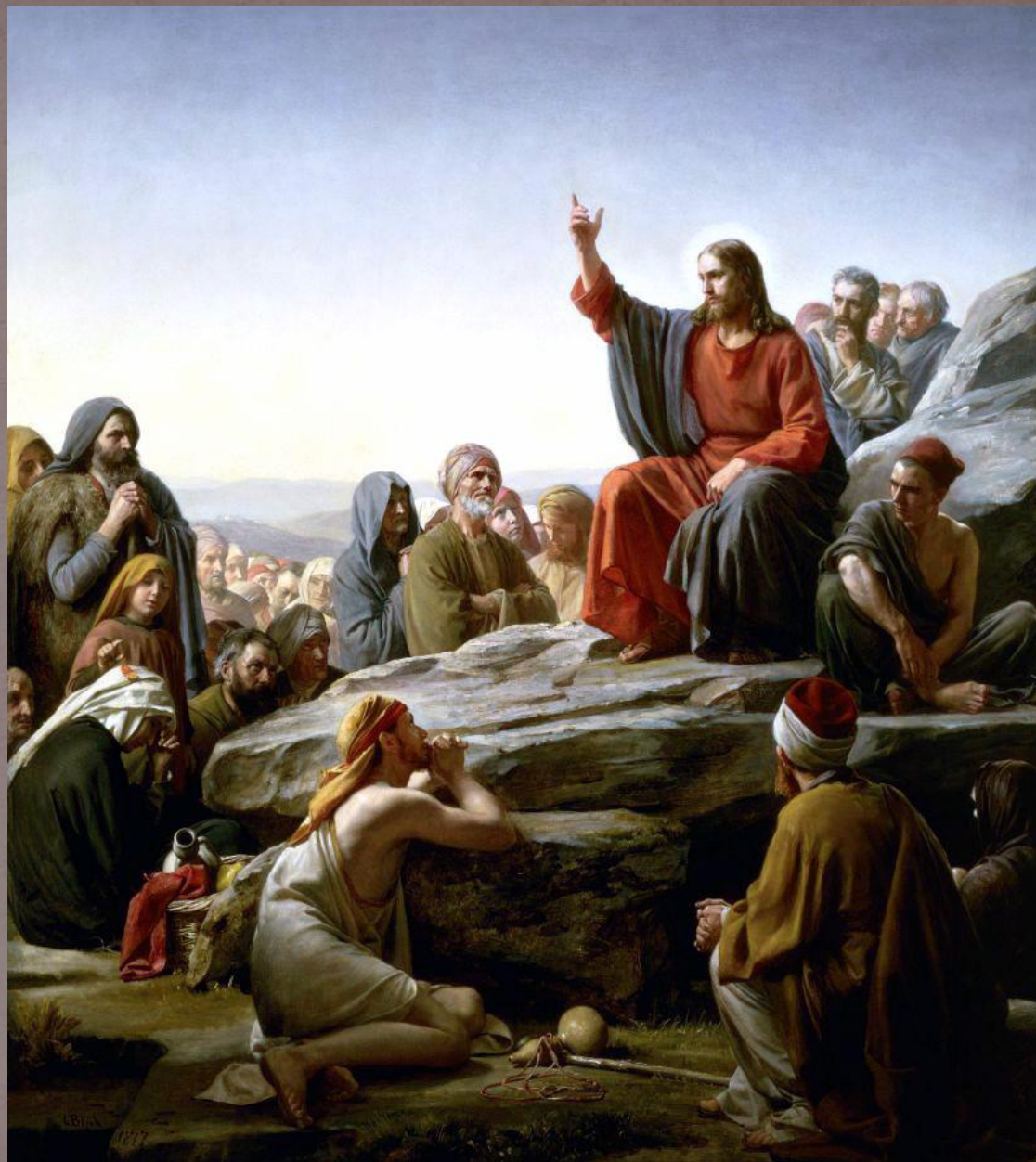
Нагорная проповедь. Карл Генрих Блох