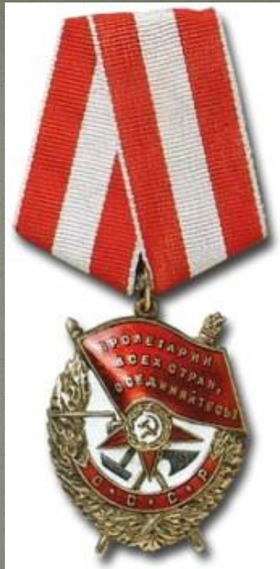
Орден Красного Знамени