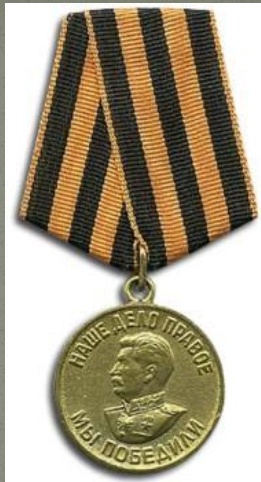
Медаль «За победу над Германией в Великой Отечественной войне 1941-1945 гг»