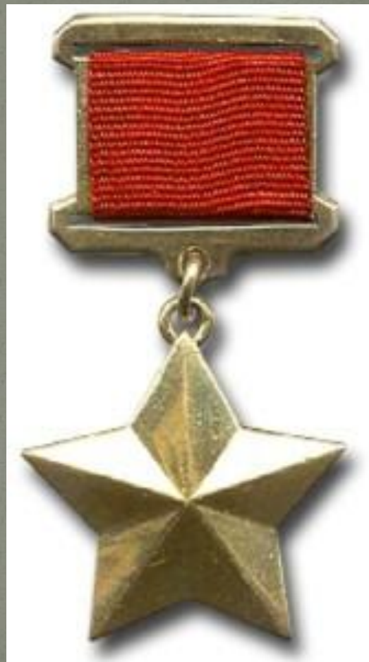
Медаль «Золотая Звезда» Героя Советского Союза