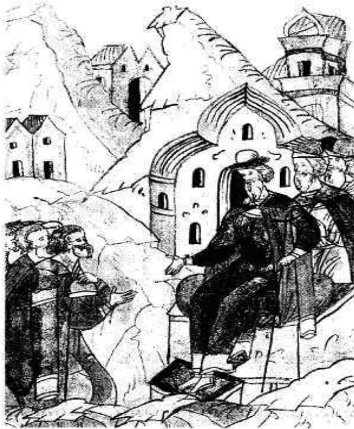
Иван III раздает поместья. Миниатюра из летописи

Поместье – форма феодального землевладения, предоставляемое с условием несения службы