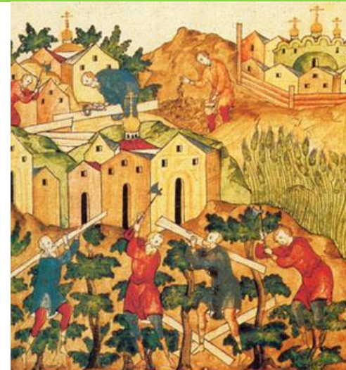
Работа крестьян в монастырском хозяйстве. Миниатюра из "Жития Сергия Радонежского". XVI в.

Пожилое – денежная компенсация крестьянина феодалу за то, что последний теряет рабочую силу.