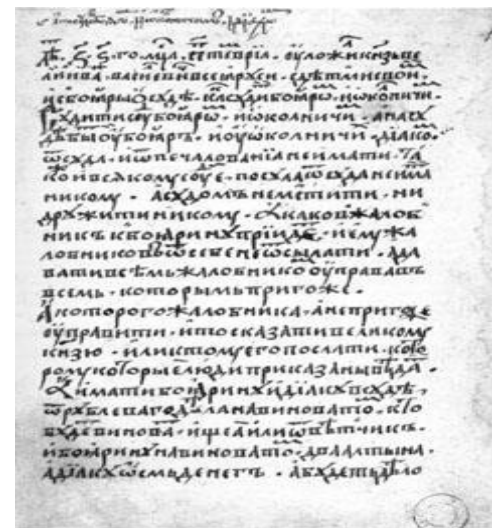
Судебник Ивана III. 1497 г. Фрагмент