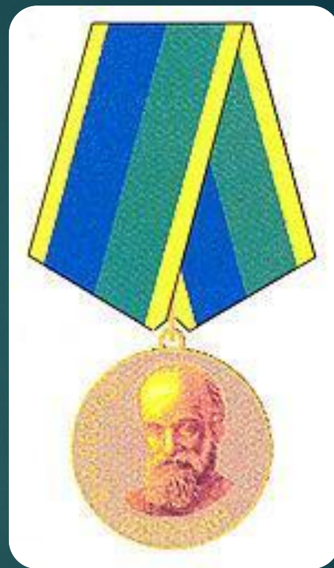
Ведомственная медаль Министерства спорта Российской Федерации.