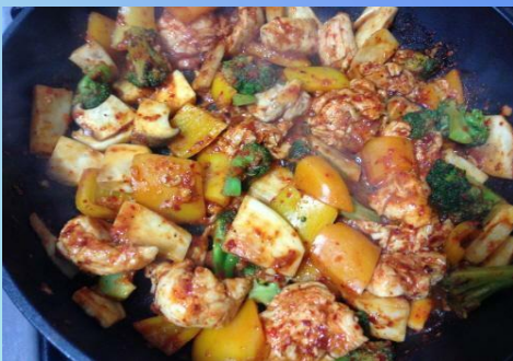
-Курица с овощами Тхак Тори Танг 60.000сум/1 кг