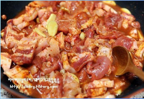
-Маринованная свинина Теук Поккым 110.000сум/1 кг