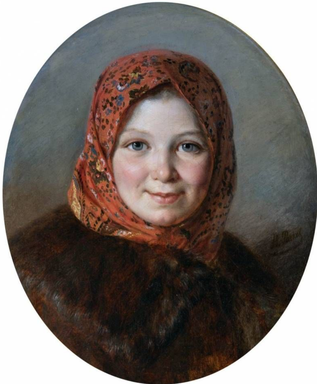
«Девочка в платке»