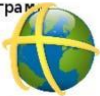
Ad-Aware Free Internet Security