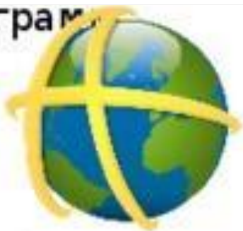
Ad-Aware Free Internet Security