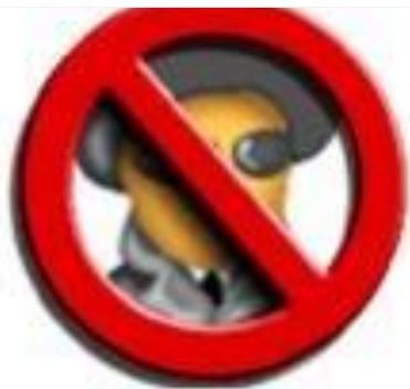
програм SuperAntiSpyw re