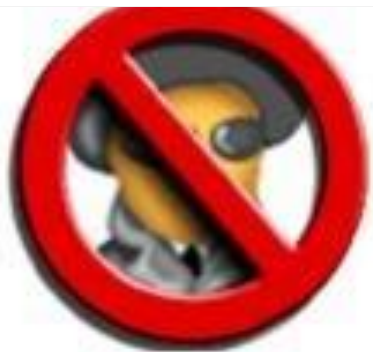
програм SuperAntiSpyw re