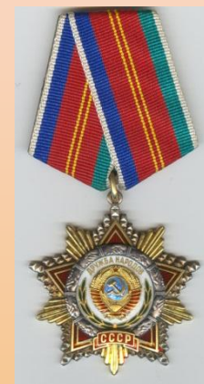
Кавалер ордена Дружбы народов (1976).