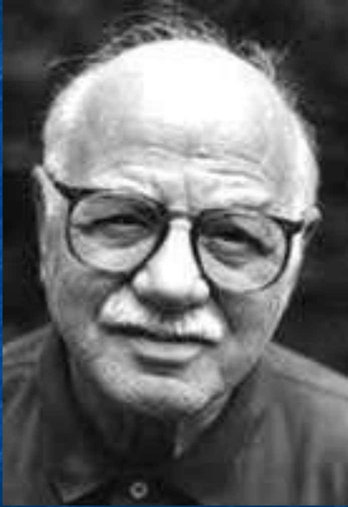
Даниэль Белл 1919-2011 гг.

История развития общества проходит три основные стадии: