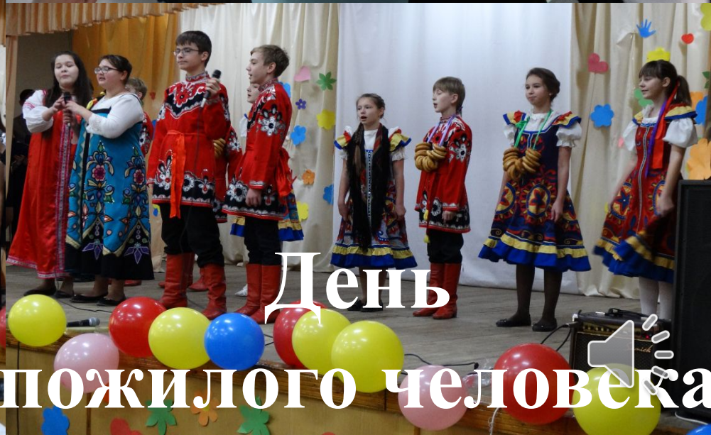
День пожилого человека