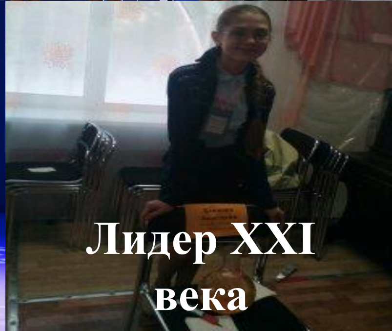
Лидер XXI века