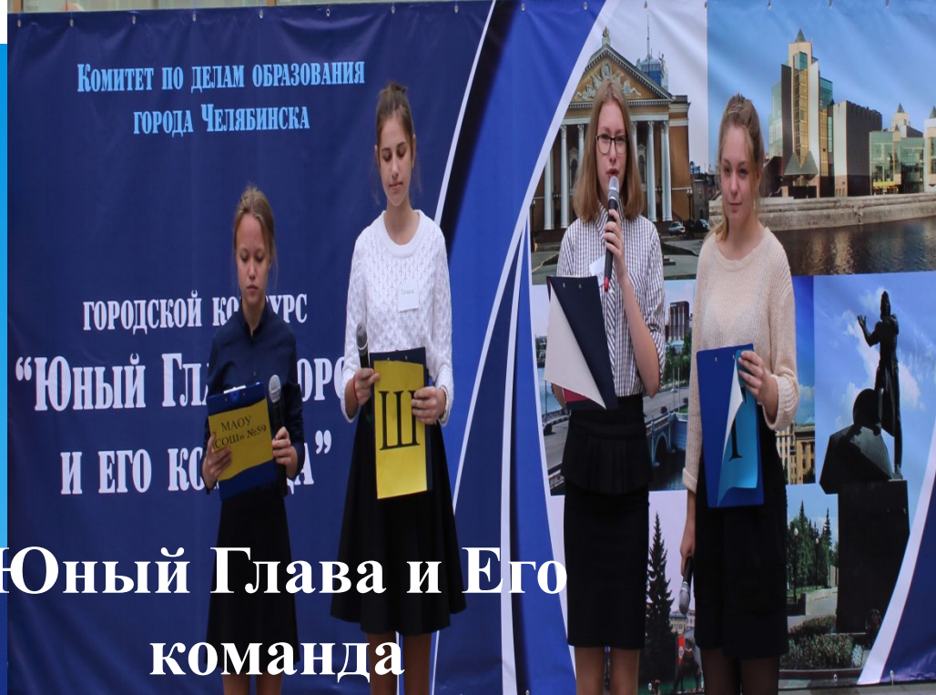
Юный Глава и Его команда