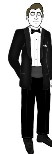
Деловой стиль для особых случаев