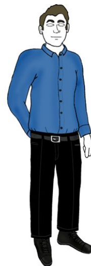
Элегантный повседневный стиль