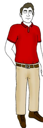
Повседневно- деловой стиль