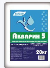
Акварин, Буйские удобрения