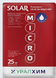
SOLAR NPK Micro