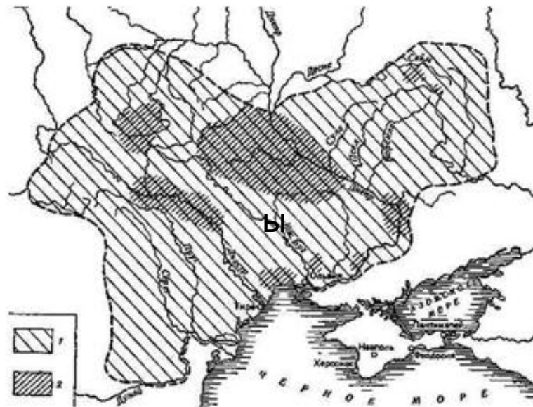
Рис. 87. Готия: территория черняховской культуры [208, с. 674]. Готы контролировали также Крым и прилегающие территории.