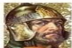
Александр Невский (1252-1263)