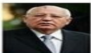
Михаил Горбачев (1985-1991)