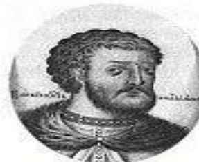
Иван Красный (1353-1359)