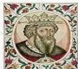
Владимир Святой (978-1015)