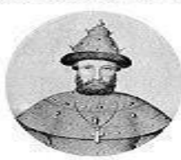
Василий II Темный (1445-1446)