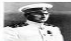
Александр Колчак (1918-1920)

С началом Гражданской войны появилось два центра власти — «Белый» во главе с Колчаком и «Красный» во главе с Лениным