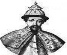
Симеон Гордый (1340-1353)