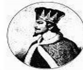
Ярополк Окаянный (1018-1019)

* Двойное княжение Ярополка и Ярослава связано с междоусобной войной между братьями и переходом Киева из рук в руки.