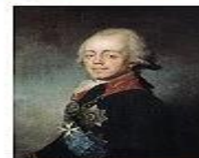
Павел I (1796-1801)