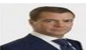
Дмитрий Медведев (2008-2012)