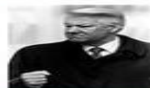
Борис Ельцин (1991-1999)

В 1991 году СССР прекращает свое существование. Поэтому далее речь пойдет о президентах России.