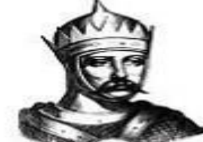
Юрий Долгорукий (1149-1151)