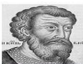
Юрий Галицкий (1434)