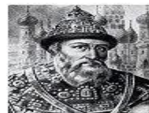
Иван III Великий (1462-1505)