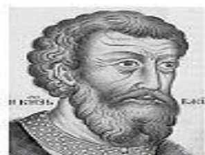
Юрий Галицкий (1433)