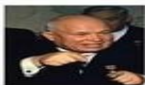
Никита Хрущев (1953-1964)