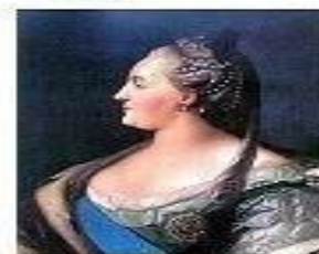
Екатерина II Великая (1762-1796)