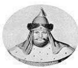
Василий I (1389-1425)