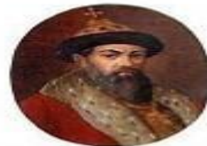
Владимир Мономах (1113-1125)