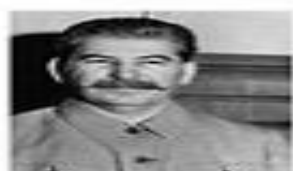
Иосиф Сталин (1922-1953)