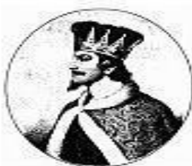
Ярополк Окаянный (1015-1016)