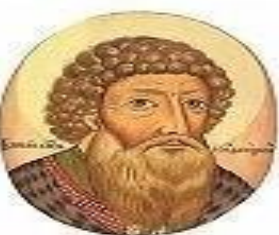
Иван Калита (1328-1340)