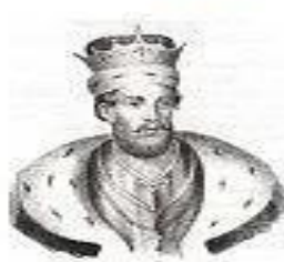
Василий Костромской (1272-1276)