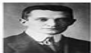
Александр Керенский (1917)