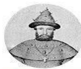
Василий II Темный (1434-1445)

* Частые переходы великокняжеского престола обусловлены междоусобной войной 1425-1453, которая кончилась только со смертью Дмитрия Шемяки в 1446 году.