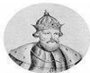
Ярослав Тверской (1263-1272)