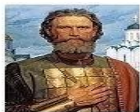
Дмитрий Донской (1363-1389)