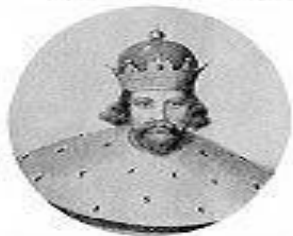
Андрей Городецкий (1294-1304)

* 1281-1294 – междоусобная война в Северо-восточной Руси