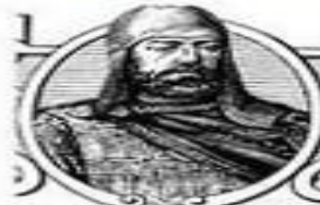
Михаил Хоробрит (1248)