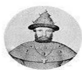
Василий II Темный (1447-1462)