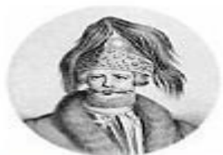
Мстислав Великий (1125-1132)