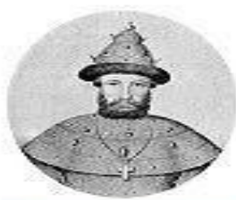
Василий II Темный (1433-1434)