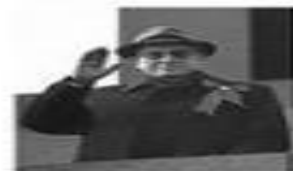
Юрий Андропов (1982-1984)