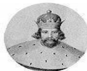
Андрей Городецкий (1281-1283)