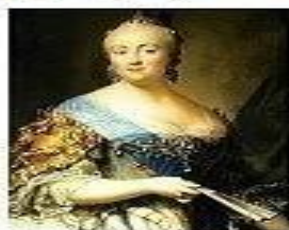
Елизавета Петровна (1741-1761)