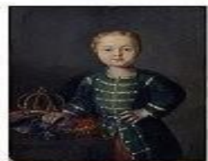
Иван VI (1740-1741)