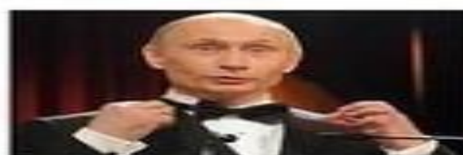
Владимир Путин (2012-?)