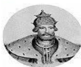
Дмитрий Переяславский (1276-1281)