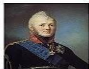
Александр I Благословенный (1801-1825)