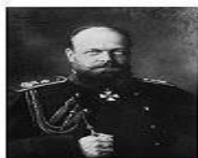
Александр III Миротворец (1881-1894)