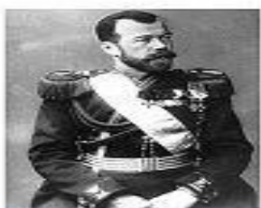
Николай II (1894-1917)