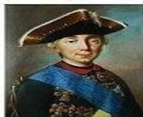
Петр III (1761-1762)