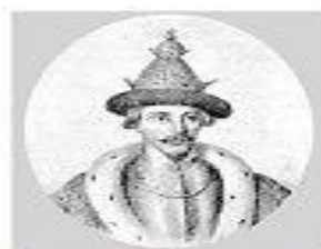
Василий Косой (1434)