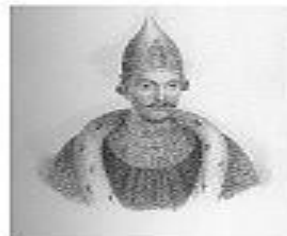
Дмитрий Грозные Очи (1322-1326)