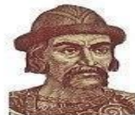
Ярослав Мудрый (1016-1018)