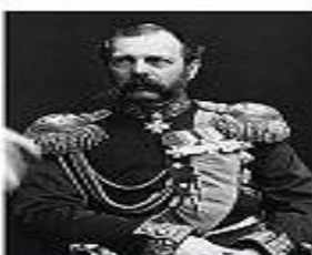
Александр II Освободитель (1855-1881)