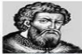
Всеволод Большое Гнездо (1176-1212)