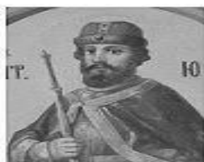
Дмитрий Шемяка (1446-1447)