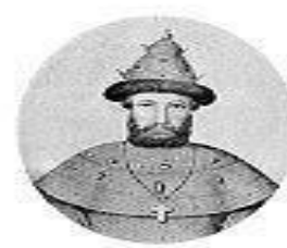
Василий II Темный (1425-1433)

В 1432 году церемония восшествия на великокняжеский престол Василия II прошла в Москве, Московское княжество стало упоминаться раньше Владимирского.