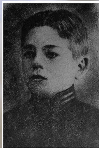
Микола Корпан загинув у бою під Крутами