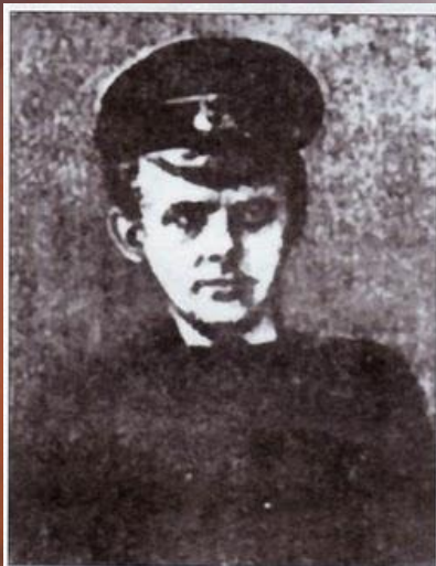
Микола Ганкевич, загинув у бою під Крутами.