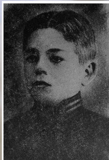
Микола Корпан загинув у бою під Крутами