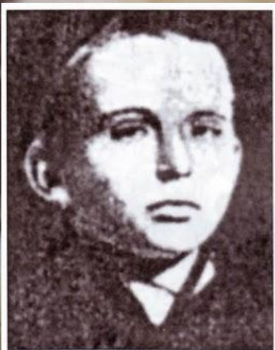
Іван Сорокевич, загинув у бою під Крутами.