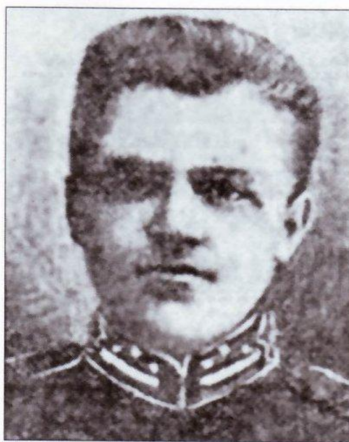
Аверкій Гончаренко, командуючий боєм під Крутами.