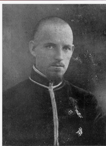
Сотник Федір Тимченко учасник бою під Крутами