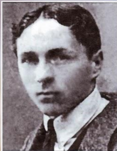
Григорій Пипський, загинув у бою під Крутами.