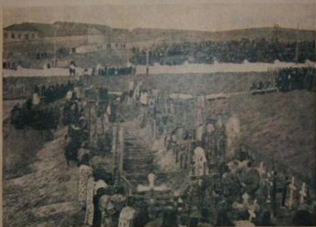
Братська могила стрільців студентів і гімназистів, забитих під Крутами.

Фото-Цинкографія друкарні Імператорського Міністерства, Надле. Редакційно-визначеної редакції В. М. У. Ц. Р. В. Давидовича 46.