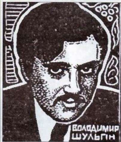
Володимир Шульгин, загинув у бою під Крутами.