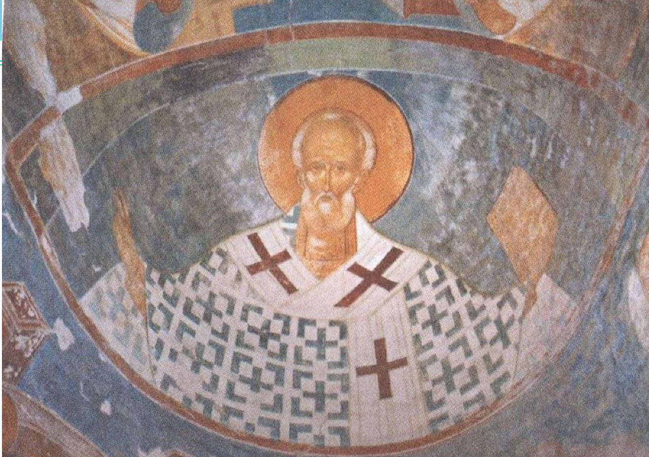
Деонисий. Святитель Николай Чудотворец. Фреска 16в.ека