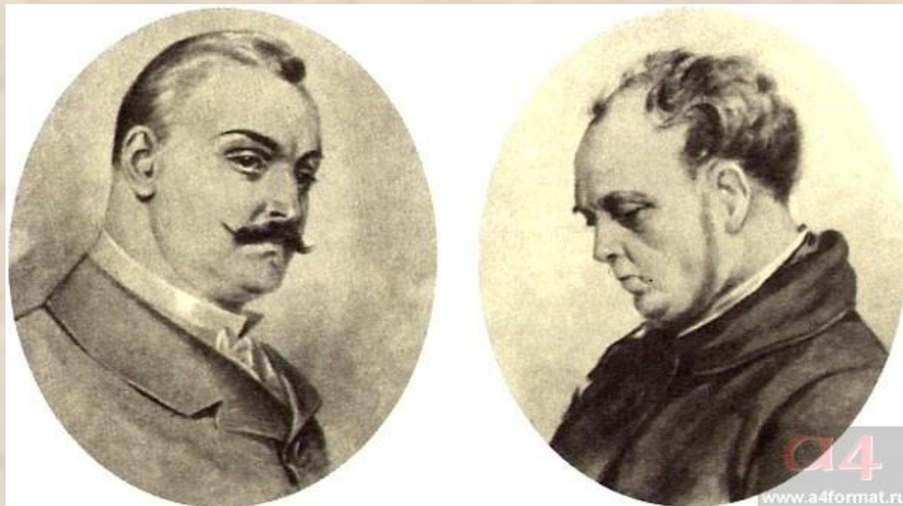
Павел Петрович и Николай Петрович Кирсановы.

Страницы романа, посвященные прошлому Николая Петровича и Павла Петровича Кирсановых, можно назвать обобщенной биографией «отцов». Очевидно, что их жизнь менялась в зависимости от внешних обстоятельств.