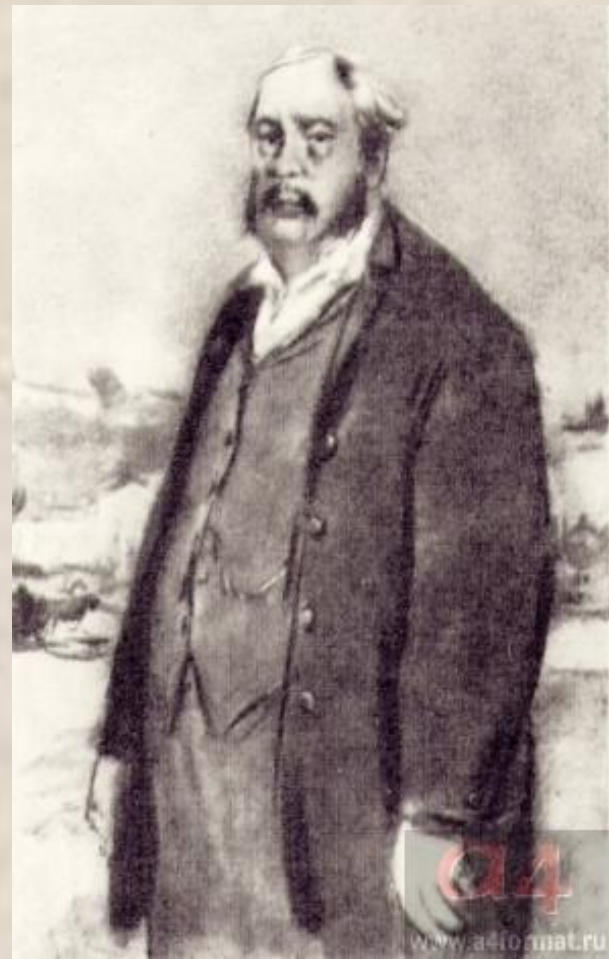
Николай Петрович Кирсанов

И.С.Тургенев писал о том, что ему близка личность и судьба Николая Петровича Кирсанова: « Николай Петрович – это я, Огарев и многие другие ». Вместе с тем писатель признавал неспособность подобных людей на решительные поступки, поэтому он вывел на страницы романа представителя другого поколения и других взглядов.