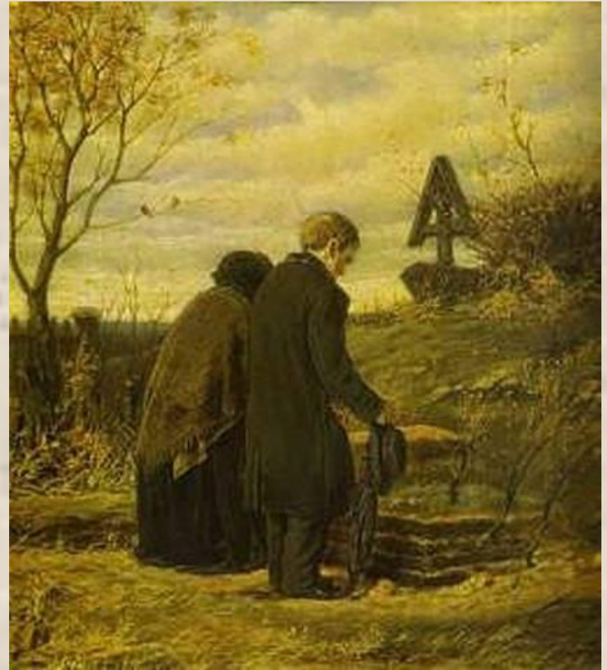
Старики-родители на могиле сына

Родители Базарова хорошие люди. Они готовы исполнить любое желание сына. Тем не менее, герой чувствует себя дома неловко. На примере семьи Базаровых И.С.Тургенев показывает конфликт поколений на сломе эпох: между родителями и сыном есть любовь, уважение, но нет взаимопонимания.