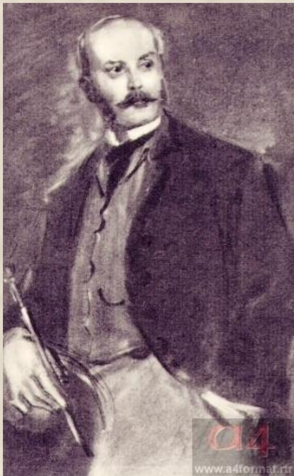
Павел Петрович Кирсанов.

Возлюбленная Павла Петровича уехала из России – он вышел в отставку, узнал о ее смерти – поселился в Марьино.