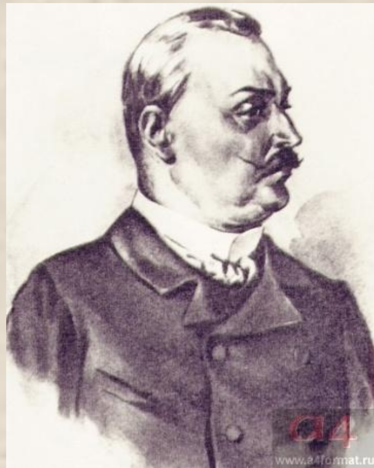
Павел Петрович Кирсанов.

Павел Петрович видит в аристократии основную общественную силу. Её представители, утверждает он, обладают исключительным чувством собственного достоинства. Базаров с ним не согласен. По его мнению, аристократы ничего не делают и, следовательно, не приносят никакой пользы обществу.