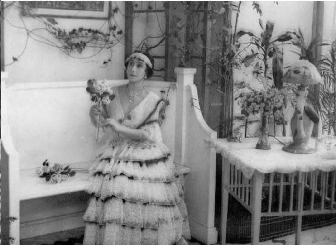
Матильда Феликсовна Кшесинская (1872 г.- 1971 г.)