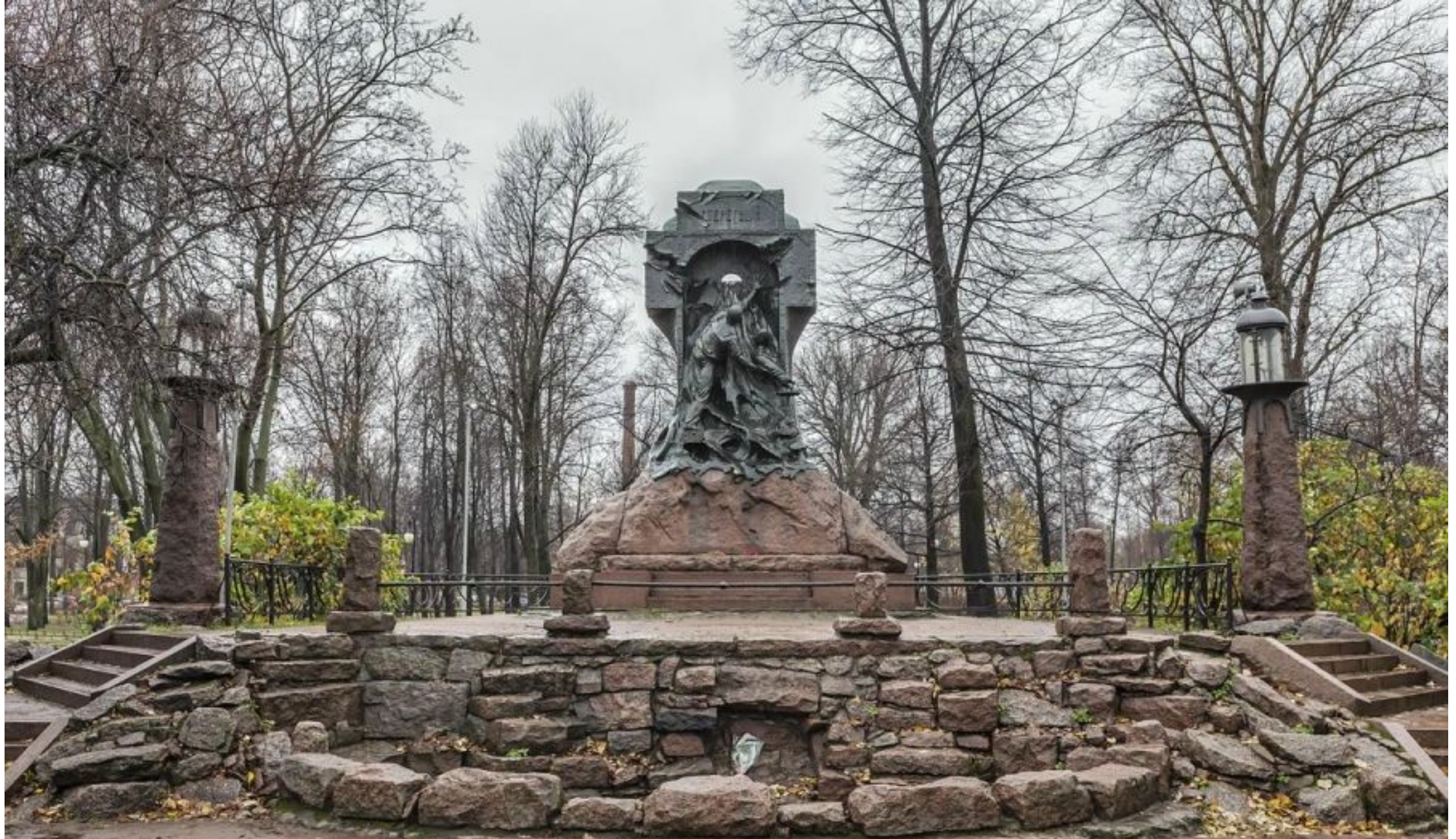
Автор проекта и строитель памятника - скульптор К. В. Изенберг при участии архитектора А. И. фон Гогена.