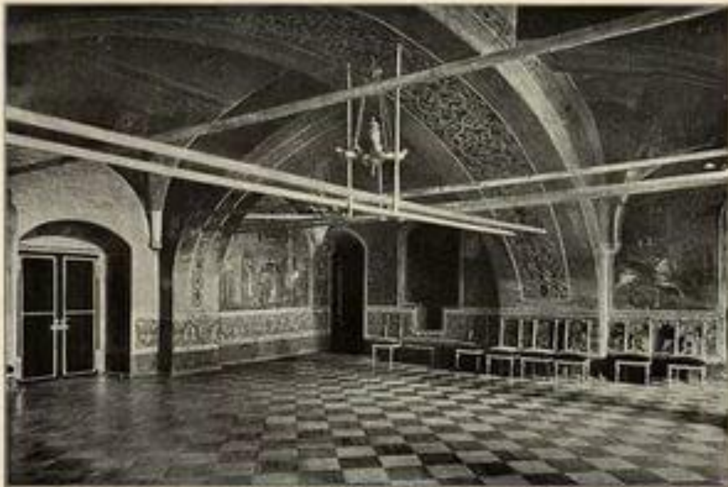
Рис. 24. Золотая Царынына Палата.