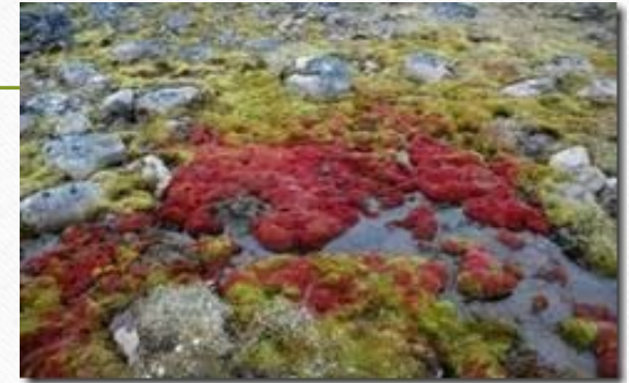
Мхи и лишайники