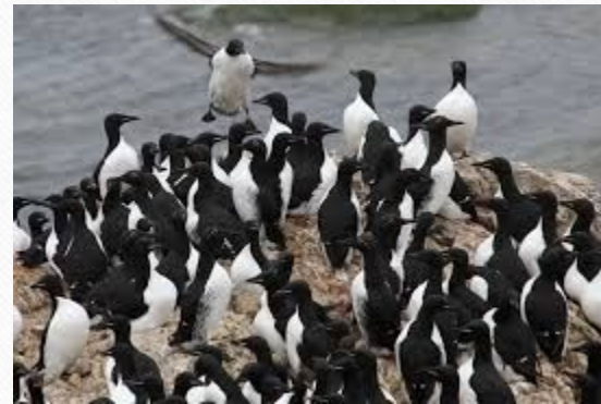
Много птиц , которые устраивают «птичьи базары»