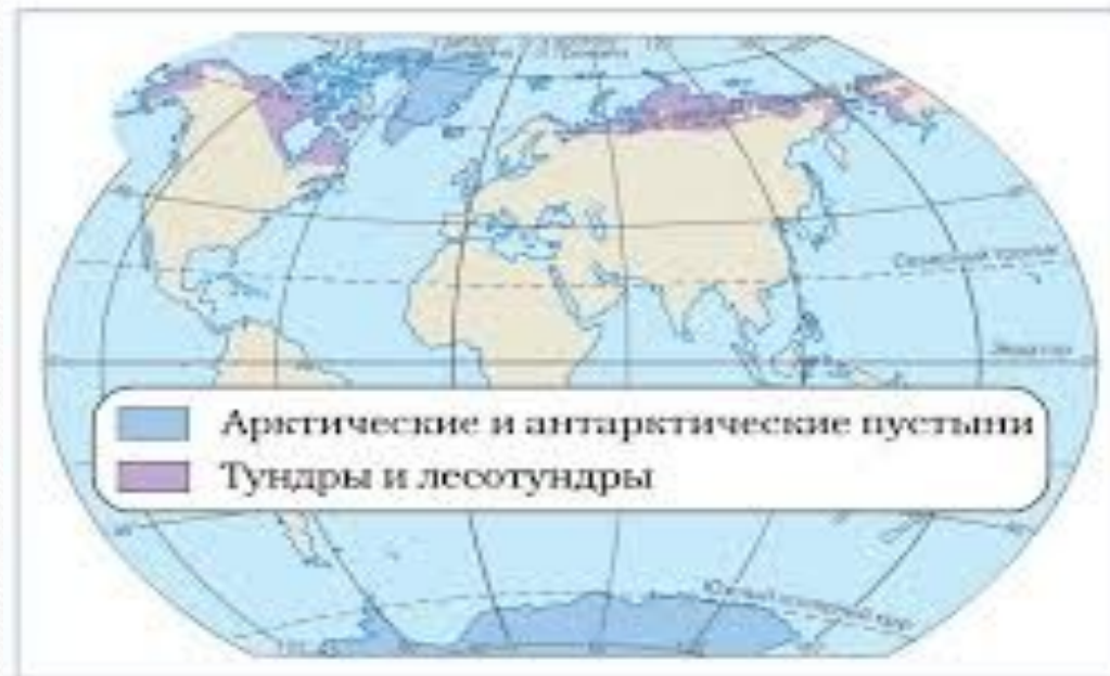
Распространение холодных пустынь и тундр

Занимают территорию арктических островов и материка Антарктида.