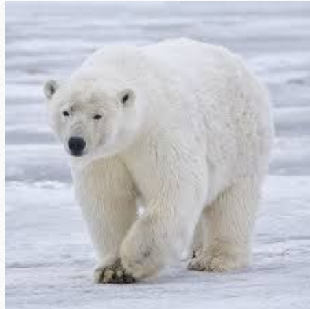
Белый медведь (Арктика)