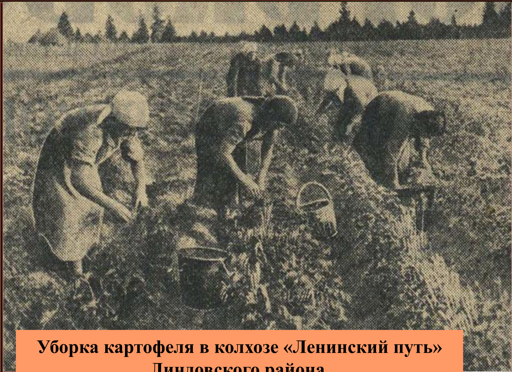
Уборка картофеля в колхозе «Ленинский путь» Линдовского района.