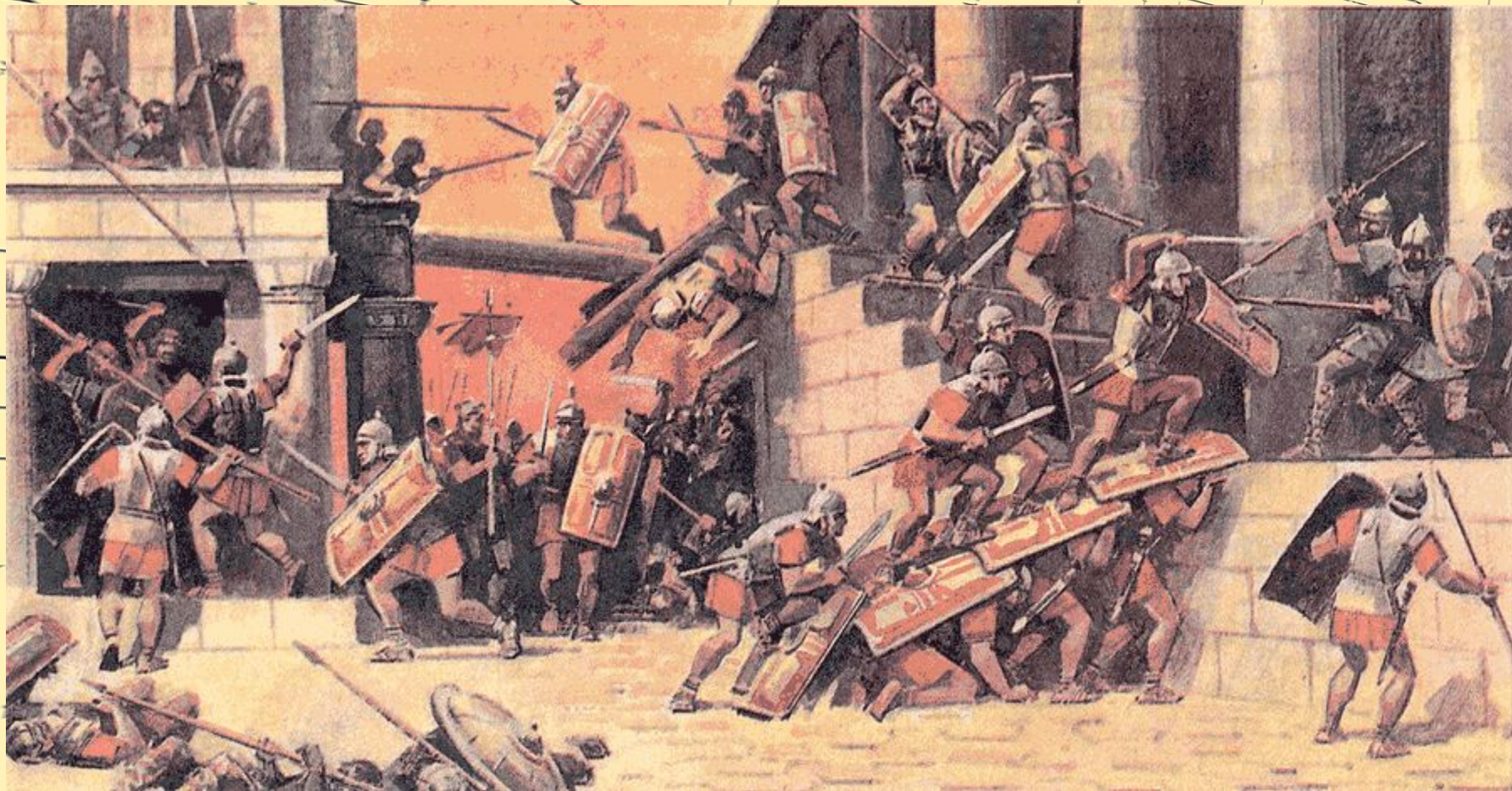
Бои на улицах Карфагена.