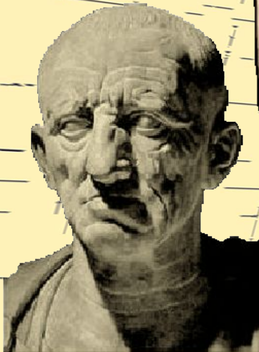
Марк Порций Катон Старший

“ CETERUM CENSEO CARTHAGINEM ESSE DELENDAM ” (“ КАРФАГЕН ДОЛЖЕН БЫТЬ РАЗРУШЕН ”).