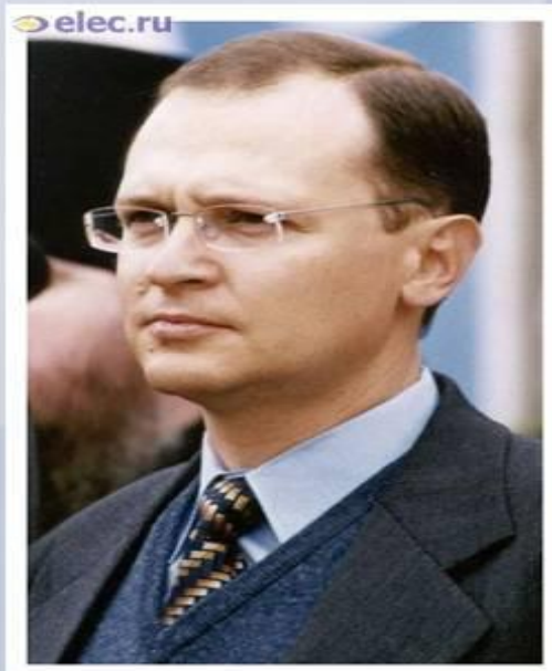
С.В.Кириенко. Премьер-министр Правительства России в марте – августе 1998 г.г.

Попытка разрешить кризис жёсткими рыночными методами