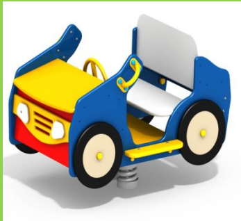
КАЧАЛКА НА ПРУЖИНЕ «ДЖИП» ДПС ДИО-4.021