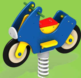
КАЧАЛКА НА ПРУЖИНЕ «МОТОЦИКЛ» ДИО-4.04