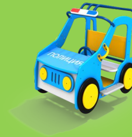
КАЧАЛКА НА ПРУЖИНЕ «ДЖИП» ДПС ДИО-4.021