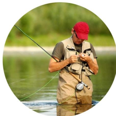
Охота и рыбалка