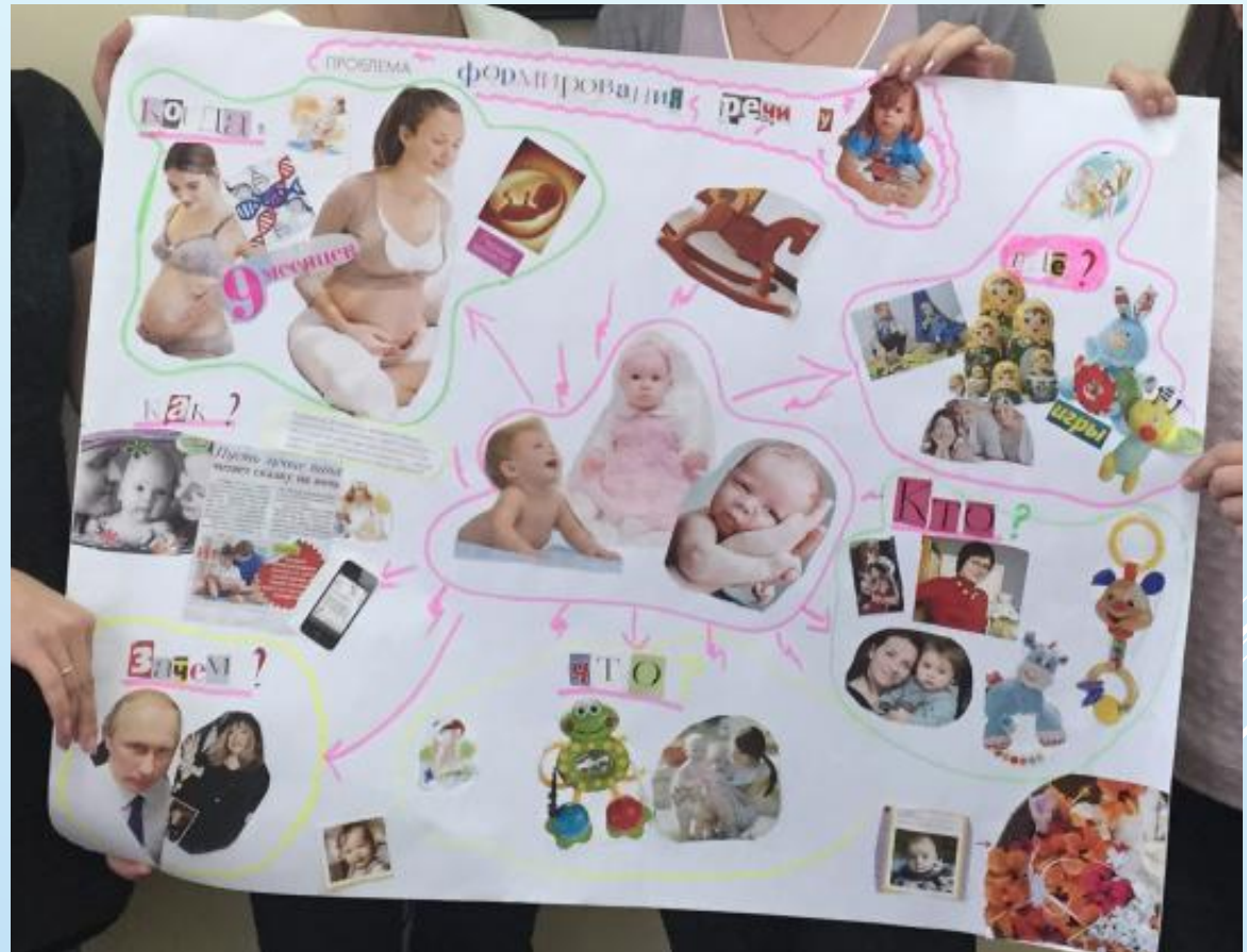
Пристендовый доклад на НПК