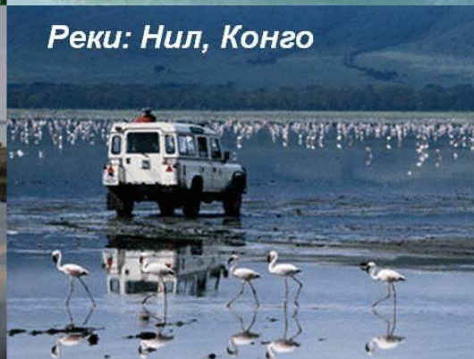
Реки: Нил, Конго